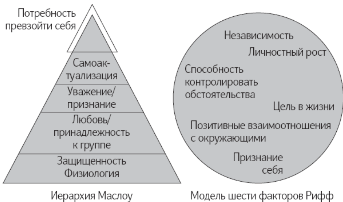
Рис. 2. Что требуется для психологического благополучия

Для них нет иерархии, хотя они близки потребностям, установленным Маслоу (рис. 2). Эти категории – традиционный предмет изучения психологов, занимающихся эмоциональным и психологическим функционированием, но именно по ним нужно проверять, требуется ли некоторым областям вашего психологического благополучия уделять больше внимания, чем другим.