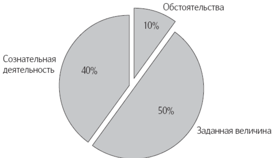
Рис. 1. Компоненты уровня счастья

Позитивные психологи Шелдон, Любомирски и Скотти создали формулу счастья, которая разбивает данные исследований на три категории – компоненты общего уровня счастья (рис. 1):