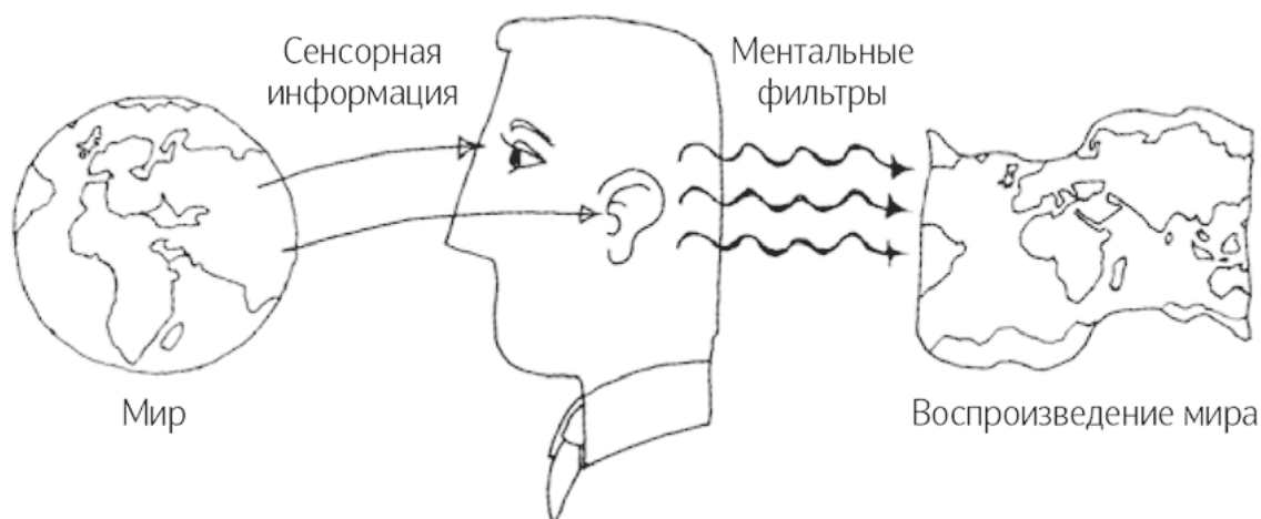
Рис. 3. Как мы рассказываем истории

Кстати, наши фильтры меняются каждый день и даже чаще – в зависимости от перепадов настроения. Успех может внушить вам оптимизм, а неудача заставит бояться малейшего риска.