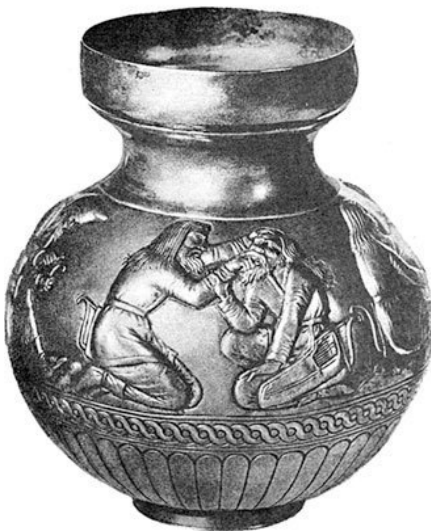
Электровый сосуд (из кургана Куль-Оба) с рельефами на темы скифского быта. IV в. до н. э. Эрмитаж. Ленинград.

Изделия боспорских ювелиров пользовались большим спросом у скифской и меотской знати. Нигде в античном мире не встречалось такое количество разнообразных и превосходно изготовленных украшений из золота, серебра и электры (смеси серебра с золотом), как в Северном Причерноморье. При этом лучшие ювелирные изделия находят при раскопках не боспорских городов, и даже не погребений местных жителей, а знаменитых на весь мир царских скифских курганов. Громадной сенсацией стало открытие в 1830 г. гробницы скифского царя в Куль-Обе неподалеку от Керчи со знаменитой кульобской вазой, выполненной из электры.