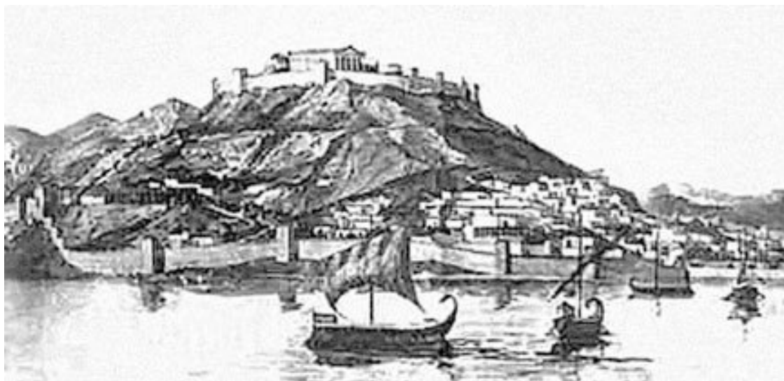
Пантикапей (Керчь) во время расцвета Боспорского царства. Реконструкция.

Зерно вывозилось в Афины, скот, рыба и рабы – на Родос, в Пергам, Кос и Синопу. Одним из самых крупных невольничьих рынков античности стал Танаис – город, расположенный в устье Дона. Туда соседние племена привозили рабов на продажу. В обмен поступало вино, оливковое масло, ткани, изделия из металлов, высокохудожественная керамика. В городах Боспора развивались керамическое и ювелирное ремесла. Многие изделия боспорских ювелиров археологи находят в захоронениях скифской и меотской знати.