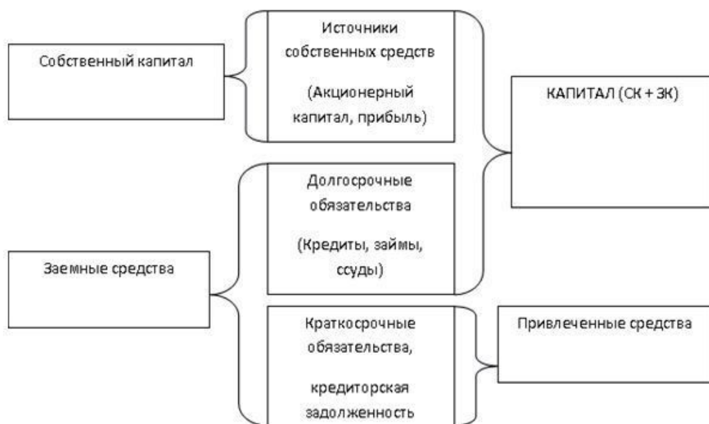
Рис. 1.2. Источники финансирования

Будем исходить из предположения, что оборотные (текущие) активы компании финансируются за счет краткосрочных источников средств (краткосрочных обязательств), а внеоборотные (постоянные) активы – за счет долгосрочных.