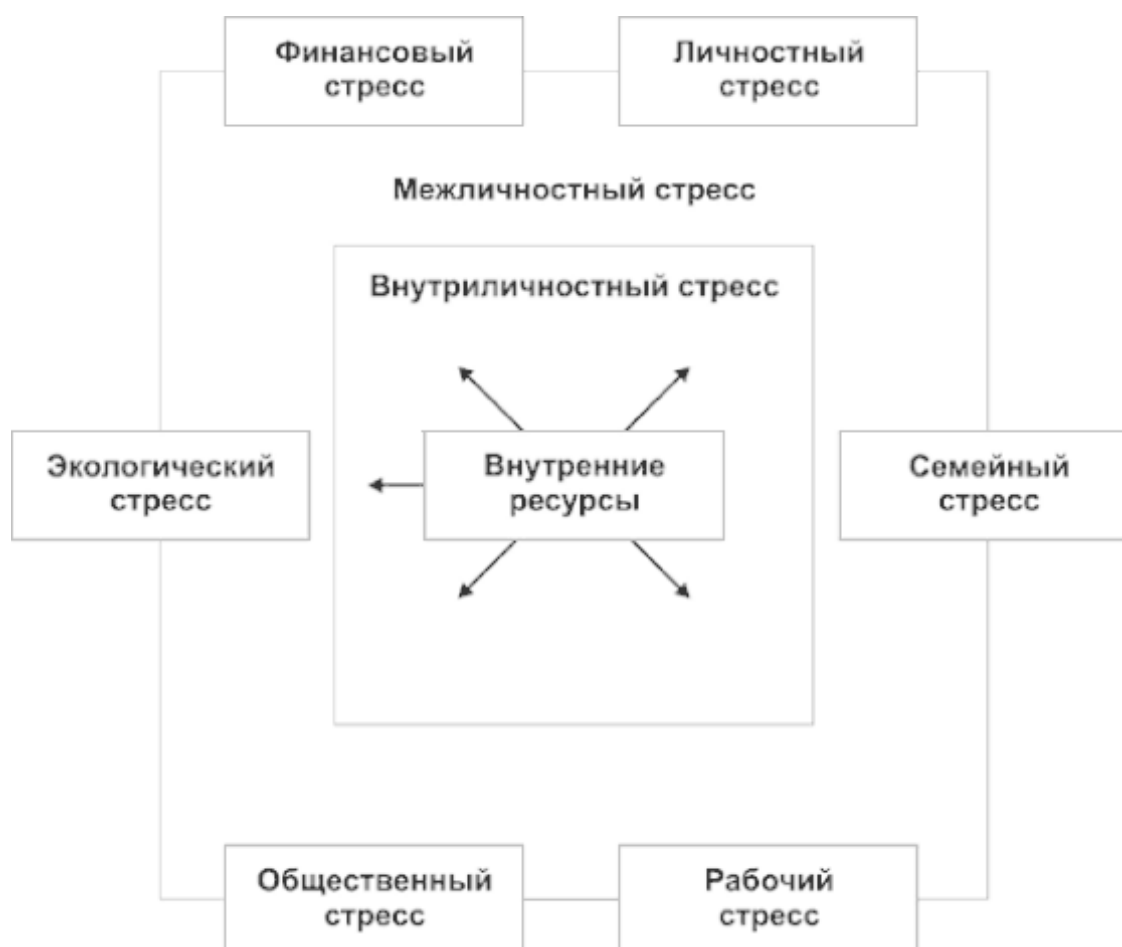
Рис. 1. Области стресса в повседневной жизни

Во внутреннем квадрате обозначена самая суть нашего существования, которую называют «Я сила», «умственная сила», психическая энергия или внутренние ресурсы. Это то, что позволяет индивиду преодолевать кризисы жизни, что определяет интенсивность сопротивления стрессу. Снижение ресурса способствует повышению уязвимости к разным связанным со стрессом расстройствам, таким как тревога, страх, отчаяние, депрессия.