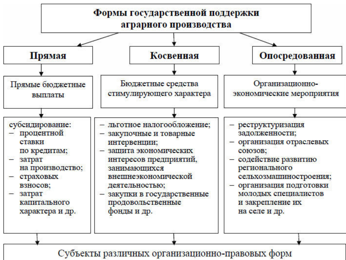
Рисунок 2 – Формы государственной финансовой поддержки сельхозтоваропроизводителей

Достаточно большое внимание ученые и специалисты уделяют формам и инструментам государственной поддержки аграрного сектора. На федеральном уровне обычно выделяют три формы (рис. 2).