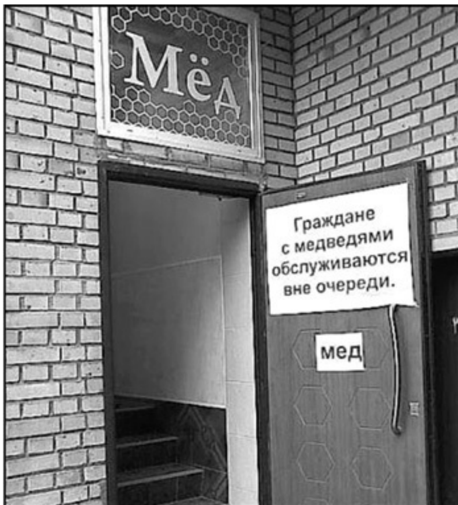
Рис. 2. Михал Иванович, хватит на балалайке играть, собирайся в магазин

Реклама противоречила всем правилам. Но у нее было одно преимущество: она задевала эмоциональные струны людей.