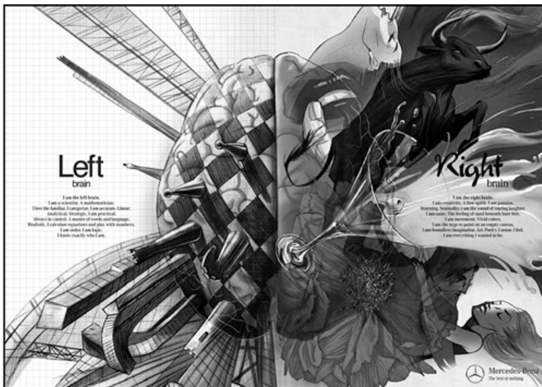
Рис. 1. Рекламный плакат «стреляет» сразу по двум «зайцам»: по левополушарным и правополушарным людям

Объявление дает понять, что рекламируемый автомобиль доставит удовольствие как левой половине нашего мозга, так и правой. Все будет прекрасно как в прагматическом, так и в эмоциональном плане.