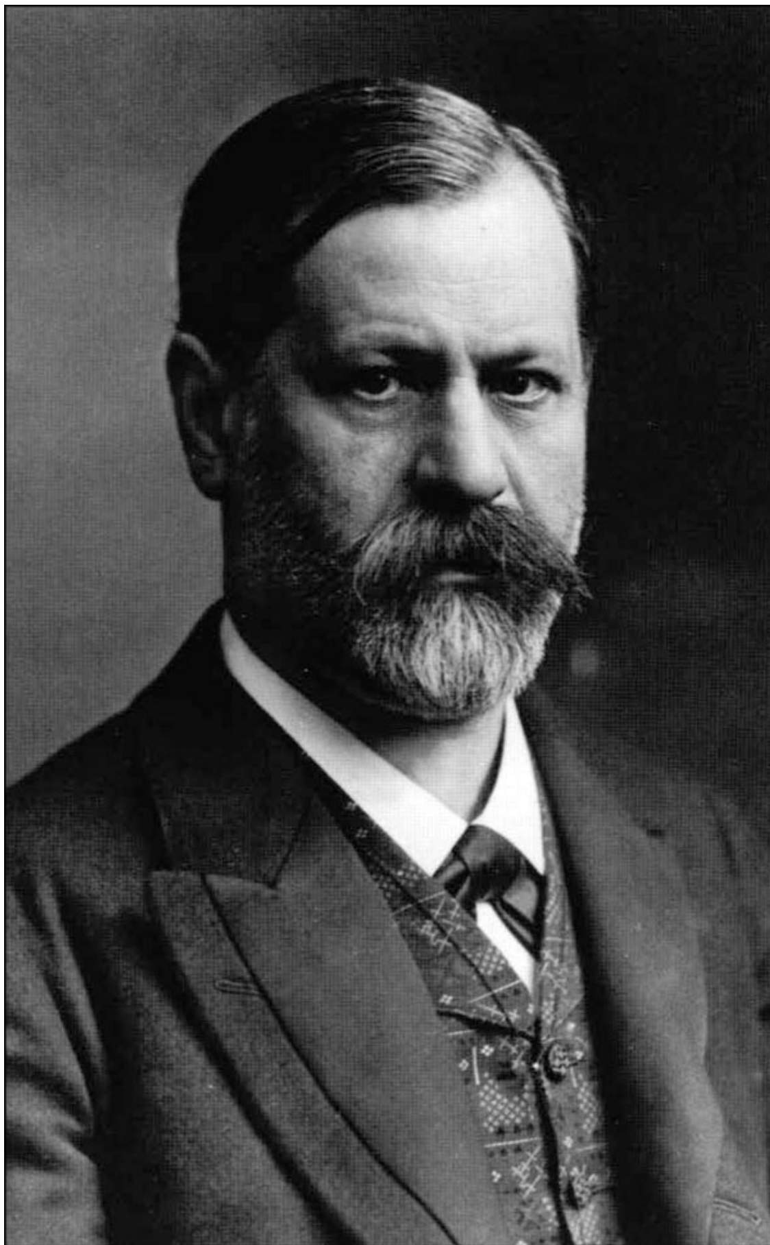
Зигмунд Фрейд (1856–1939)