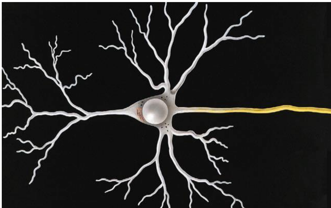
Многополярный нейрон (нервная клетка), отражающий структуру интеллект-карты

ными рабочими органами другого нейрона, и, когда электрический сигнал возбуждает нейрон, происходит передача химических агентов от одного нейрона к другому через малое заполненное жидкостью пространство между ними. (Важно понимать, что нейроны не соприкасаются между собой.)