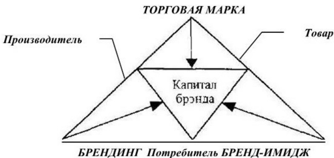
Рис. 1. Аспекты, характеризующие сущность бренда

Под брендом следует понимать отображение продукта (фирма, товар или услуга), имеющего уникальное название и символические идентификаторы (торговая марка, логотип, дизайн упаковки) в массовом сознании. Современное понимание бренда включает в себя несколько аспектов: механизм дифференциации товаров; механизм сегментации рынка; образ в сознании потребителей (бренд-имидж); средство взаимодействия (коммуникации) с потребителем; средство индивидуализации товаров, компаний 8 ; система поддержания идентичности; правовой инструмент; часть корпоративной культуры компании; концепция капитала бренда; элемент рынка, развивающийся во времени и пространстве. Вышеперечисленные аспекты позволяют понять бренд как нечто сложное, многогранное, хотя предложенные аспекты не отражают бренд как единое и целостное явление. Аспекты, характеризующие маркетинговую сущность бренда, можно представить в виде логической схемы (рис. 1).