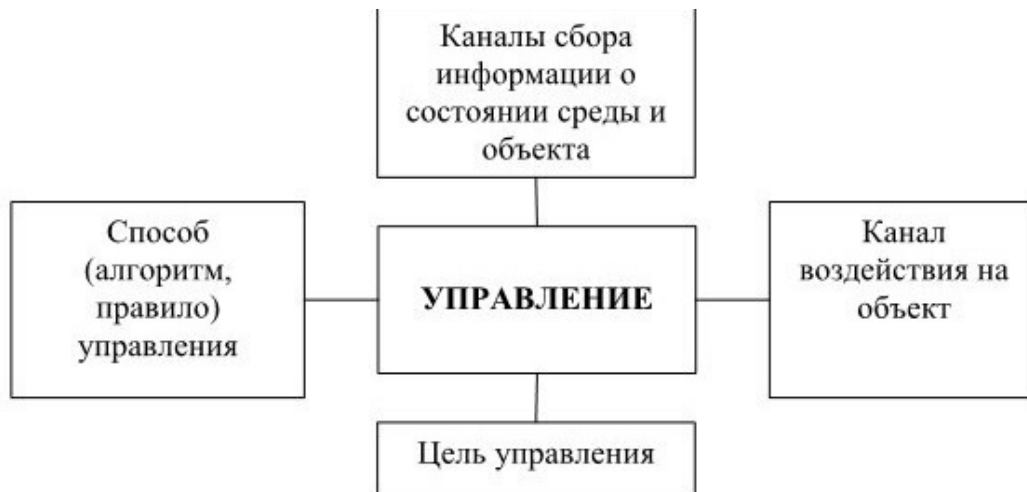
Рисунок 1.1. Элементы процесса управления.

Первоначальное понятие содержания диссертации, которое является базовой компетенцией самой организации, устанавливает элементы процесса управления (рисунок 1.1).