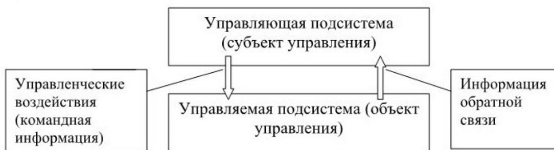
Рисунок 1.2. Структура управленческого процесса.

Любая система рассматривается как единство управляющей подсистемы (субъекта управления) и управляемой – объекта управления, основанная на принципе обратной связи, характеризующем информационную и пространственно-временную зависимость (рисунок 1.2).