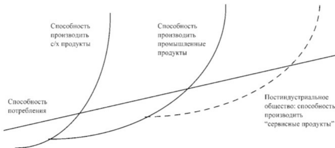
Рис. 1.1. Динамика соотношения производства и потребления в обществе 5

По мнению профессора И. В. Соколовой 4 , для характеристики постиндустриального общества важно использовать динамику соотношения производства и потребления в обществе, которая представлена на рис. 1.1.