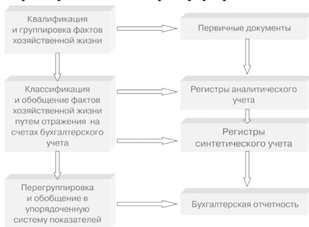
Рис. 1. Этапы обобщения учетной информации

Отличительной чертой бухгалтерской отчетности является балансовый принцип взаимосвязи ее показателей. Этот принцип вытекает из двойной записи данных на счетах, показатели которых составляют основу отчетности. Из этого следует, что бухгалтерская отчетность – это упорядоченная взаимосвязанная система показателей, характеризующих условия и результаты хозяйственной деятельности. Балансовый принцип построения бухгалтерской отчетности усиливает ее комплексный характер и облегчает проверку правильности отчетности.