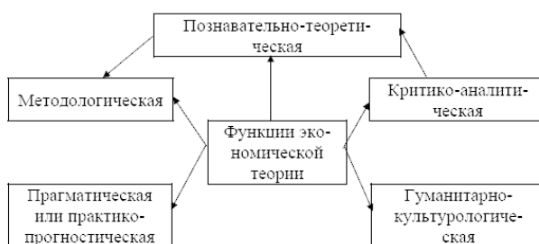
Рис. 1.2. Взаимосвязь функций экономической теории

В целом взаимосвязь функций экономической теории представлена на рис. 1.2.