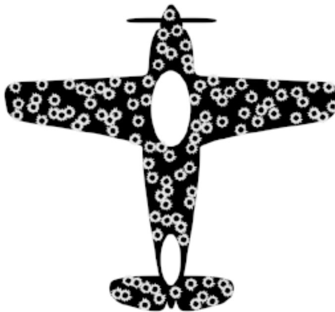
Рисунок повреждений на самолете, вернувшемся из вылета

Командование разработало план, казавшийся самым военным идеальным: защищать броней необходимо поверхности с наибольшим количеством попаданий. Именно туда попадали снаряды, а значит, эти области требовали дополнительной защиты. План был образцом здравого смысла. Для военных это был лучший способ защитить храбрых летчиков от вражеского огня.