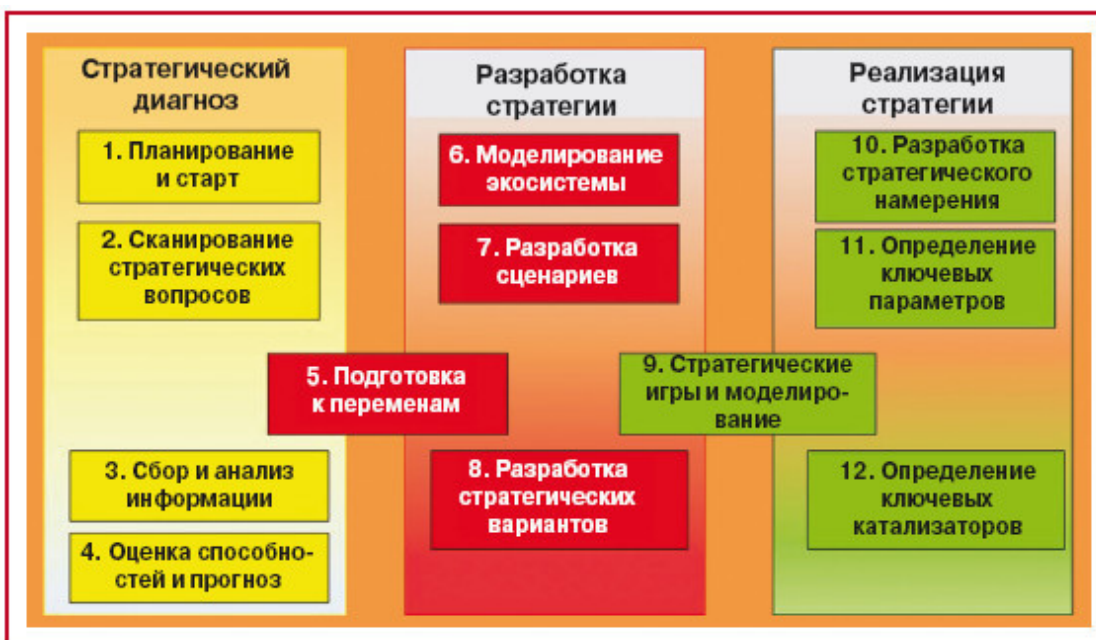
Рис. 2.5. Стратегическое управление для адаптируемых организаций

Еще один вариант последовательности задач, решаемых в процессе стратегического управления, предложен В.К. Котельниковым (см. рис. 2.5).