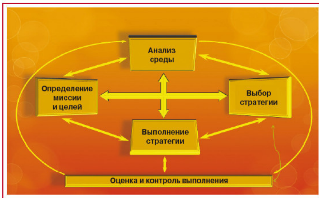
Рис. 2.2. Структура стратегического управления