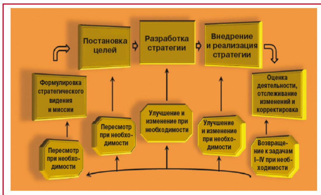
Рис. 2.1. Этапы разработки и реализации стратегии

На этапе, предшествующем внедрению стратегического планирования в качестве главной цели организации, фирмы, западные ученые рассматривали прибыль. Когда перемены во внешней среде стали существенными и непрерывными, основными стратегическими целями стали сохранение и увеличение прибыли в ближайшем будущем. Стратегическое управление на Западе ставит главной целью получение максимальной нормы прибыли и в перспективе создание «потенциала прибыли».