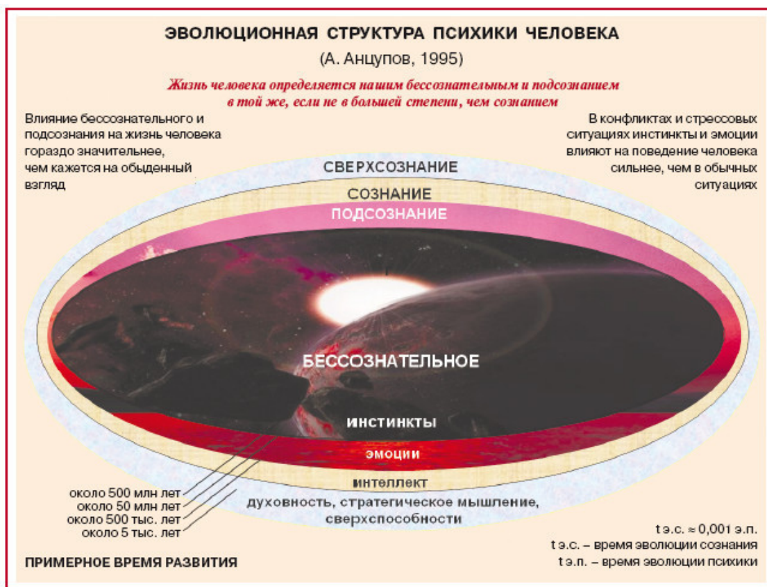
Рис. 3.1. Эволюционная структура психики человека

Сознание, свойственное человеку, возникло примерно 500 тыс. лет назад. Это высший уровень психического отражения, возникший естественным эволюционным путем. Сознание присуще только человеку как общественно-историческому существу. Интеллект отличает человека от животных и относится к сфере сознания.