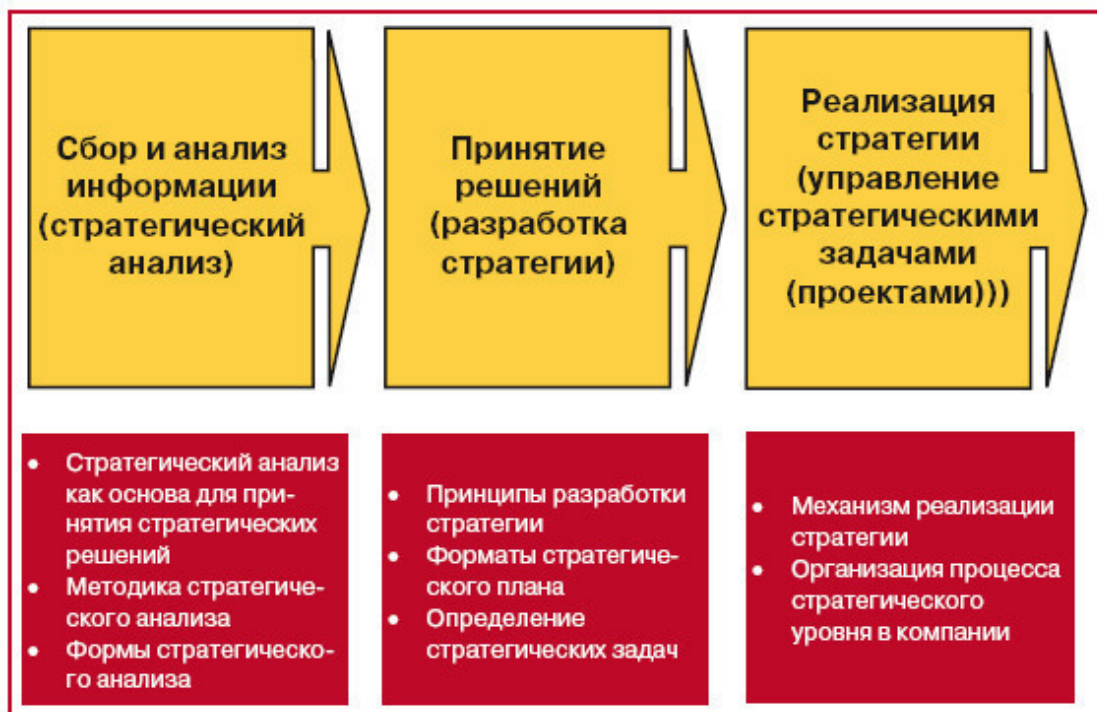
Рис. 2.6. Основные элементы стратегического управления (Карпов А.Е., 2005 г.)

Э.Н. Ожиганов поднимает сверхважную сегодня для России проблему стратегического анализа политики. Он приходит к выводу, что политические процессы представляют собой многофакторные сети взаимодействия людей и обстоятельств, для которых не существует генерализующих теорий. С одной стороны, их развитие нельзя планировать на основе изолированной классификации каких-либо групп факторов. С другой – стратегический анализ «вычисляет» базовые характеристики этих групп главных факторов, прежде всего: а) основных игроков политической сцены; б) ресурсов, которые они используют для достижения своих целей; в) тактик, применяемых ими; г) сил, на которые они опираются в борьбе за господство.