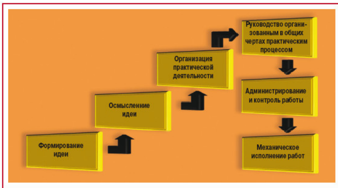
Рис. 2.4. Этапы деятельности по спасению России. Проект Россия (с. 9—10)

Еще один вариант последовательности задач, решаемых в процессе стратегического управления, предложен В.К. Котельниковым (см. рис. 2.5).