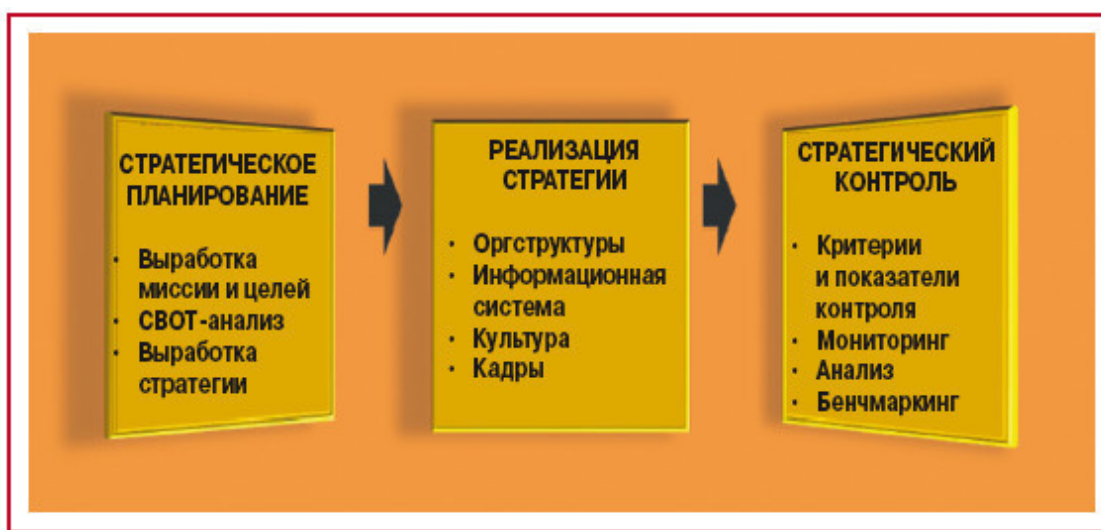
Рис. 2.3. Составные элементы стратегического управления

В ряде других работ также предлагаются варианты основных этапов, которые включают стратегическое управление. Например, в оригинальной и глубокой работе, посвященной перспективам развития России в XXI в. 5 , обосновываются следующие этапы деятельности по ее спасению (см. рис. 2.4). Анализ этих этапов показывает, насколько нелегко структурировать процесс стратегического управления.