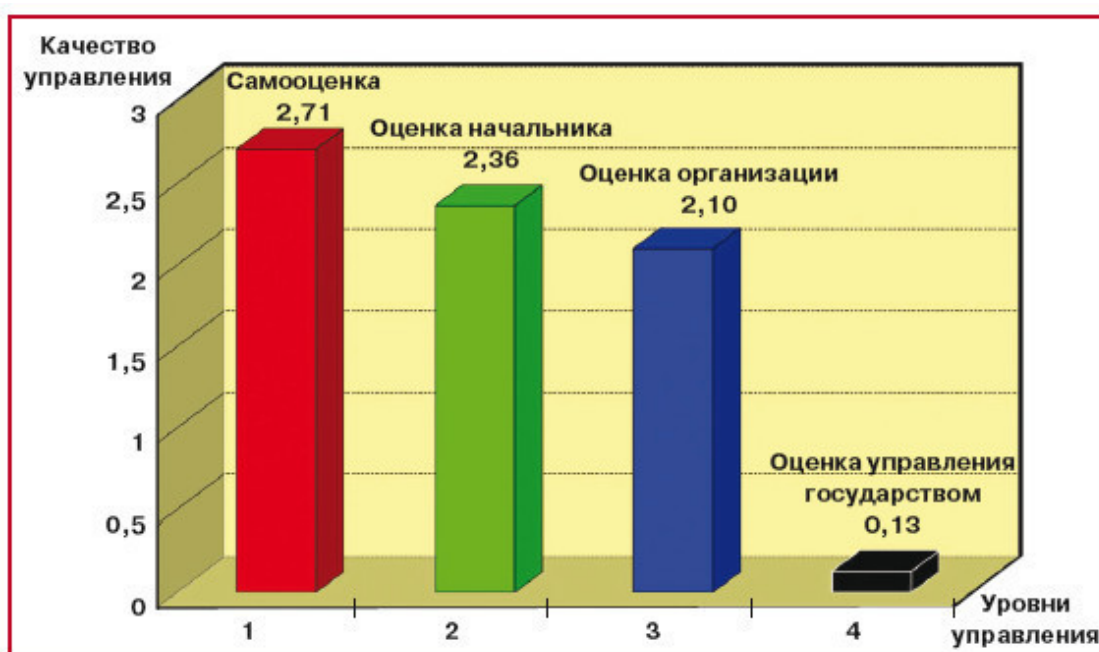
Рис. 1.2. Оценка качества стратегического управления

Оценка руководителями среднего звена качества стратегического управления на уровне организации оказалась заметно выше, чем на государственном уровне (см. рис. 1.2).