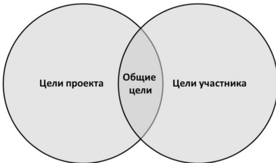
Рисунок 1. Триада целей

Эти три группы должны дополнять друг друга и выполняться синхронно (рисунок 1). Цели проекта – это то, что движет лидером команды. Цели участника мотивируют его самого. Общие цели – это тот «мостик», который помогает лидеру «достучаться» до каждого члена команды и замотивировать его на эффективную совместную деятельность.