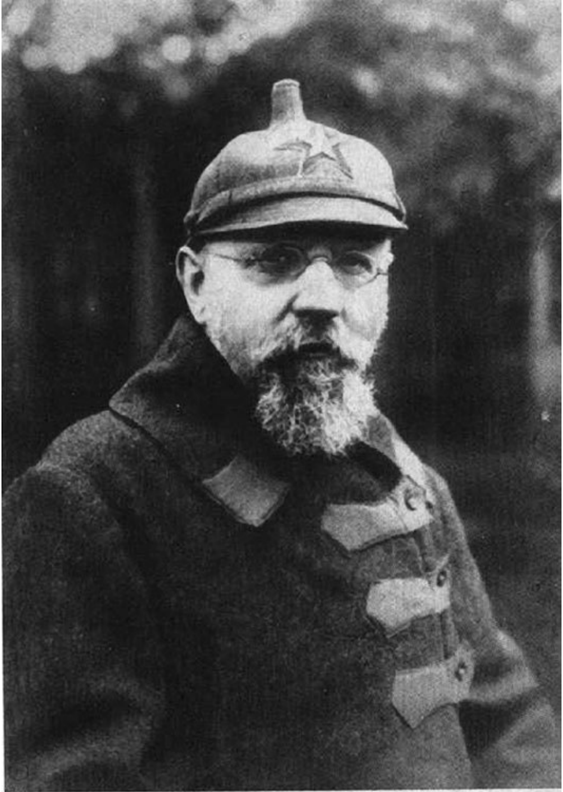
М. Н. Покровский

ной Европы в период Первой мировой войны. В том числе редактировал и указанную книгу В. И. Ленина. Судя по некоторым свидетельствам, будущий академик сильно ужал присланную рукопись (объём публикации примерно на порядок меньше объёма подготовительных материалов) и придал ей вид весьма привлекательной и популярной брошюры. Первое издание книги вышло с подзаголовком «Популярный очерк».