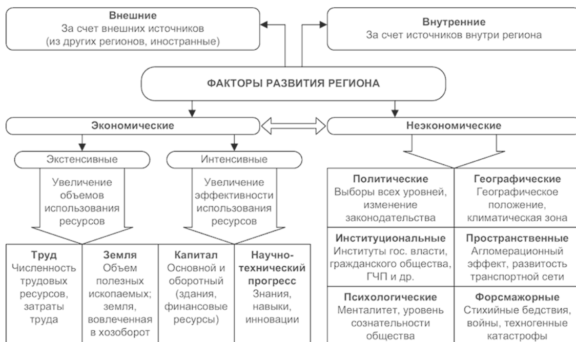
Рисунок 1. Классификация факторов развития региона.

В общем виде факторы, оказывающие влияние на развитие региона, можно классифицировать на экономические и неэкономические (рис. 1). Источники данных факторов могут быть внутренними и внешними.