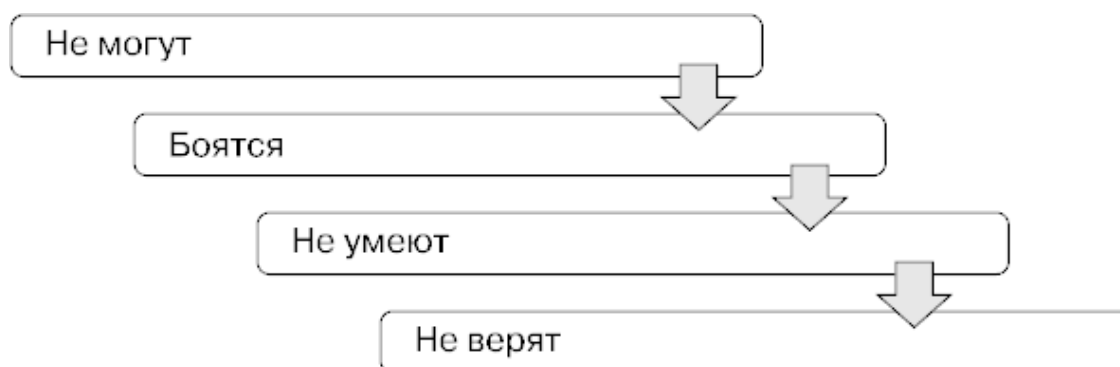
Рис. 1.1. Причины, по которым звонящий испытывает препятствия в совершении звонка