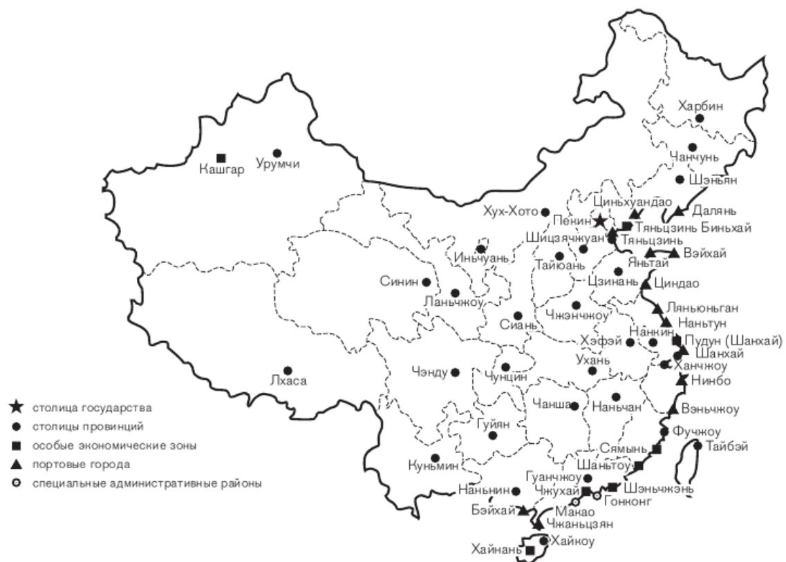
Административное деление КНР (С особыми экономическими зонами)