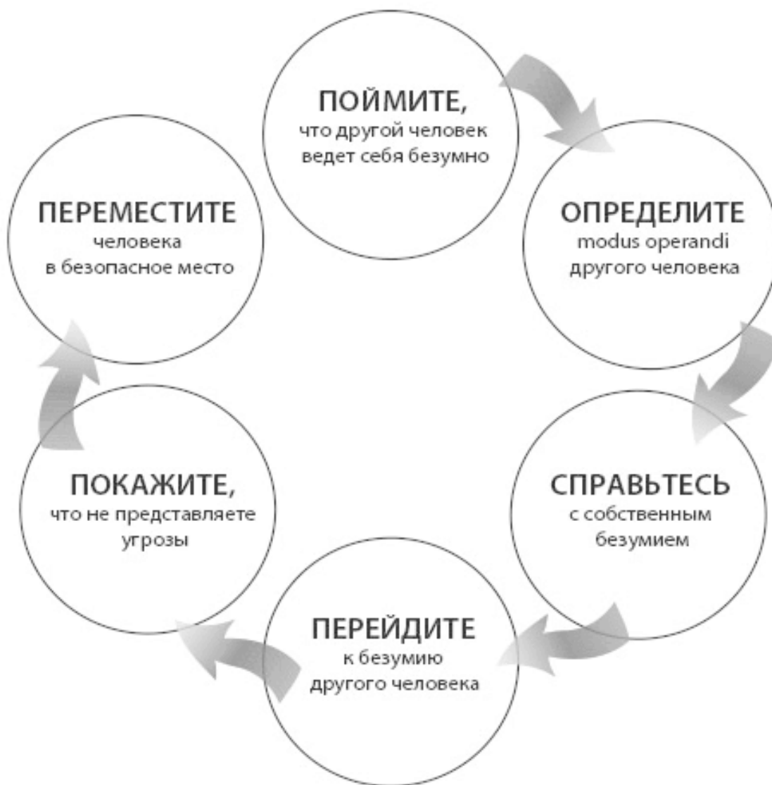
Рис. 1.1. Цикл благоразумия

Вот что вам нужно делать на каждом этапе этого цикла.