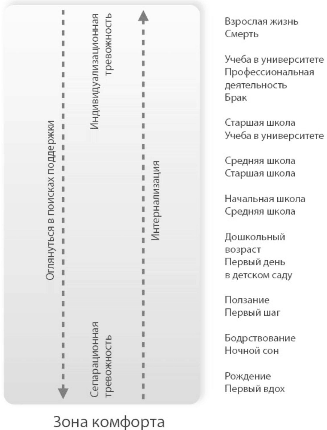
Рис. 2.1. Развитие личности

Но что если в сложный момент мы не получаем нужной поддержки? Перед лицом неизвестности мы теряем уверенность, реже добиваемся успеха, чаще ошибаемся. Получается, что после каждой пары шагов вперед мы делаем уже три шага назад. Усваивая подобную схему поведения, человек теряет способность развиваться и адаптироваться, замыкается в рамках