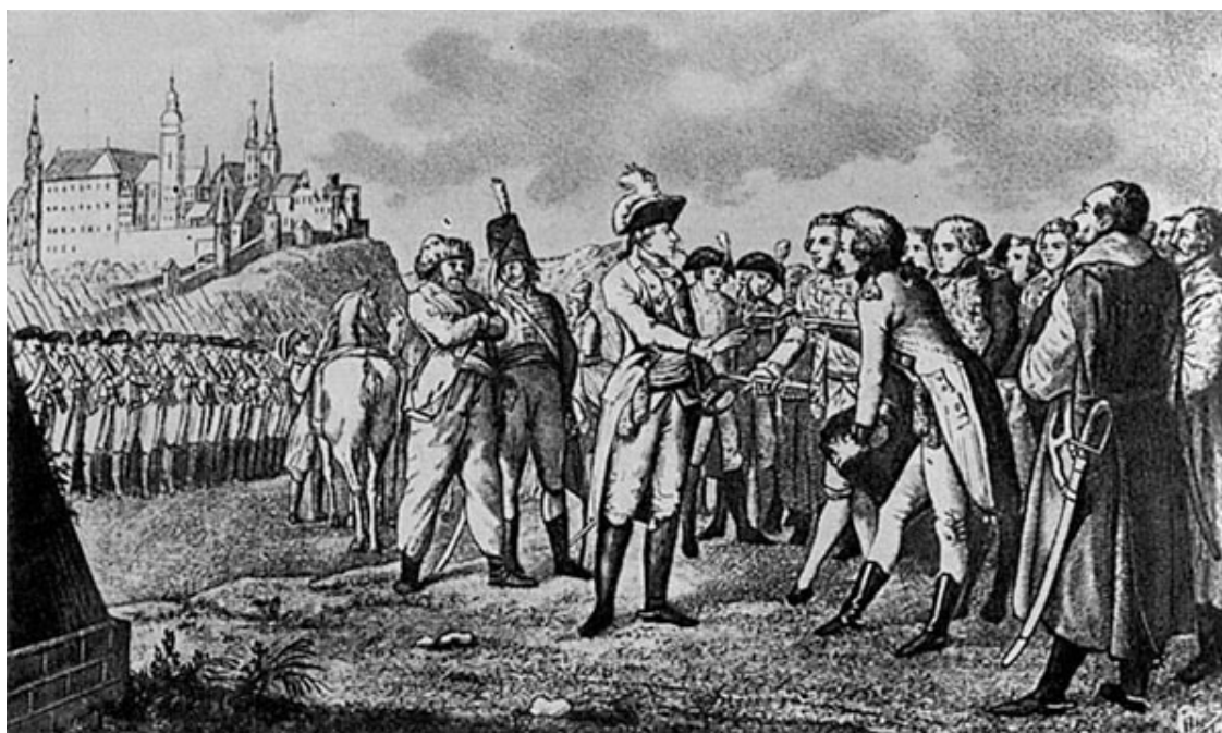
Сдача Краковского замка А.В. Суворову. 1772 г. Гравюра XVIII в.

Часто эту войну изображают как русско-польскую, и, более того, для Польши национально-освободительную, что в корне неверно. Эта война имела все признаки гражданской войны с ярко выраженным религиозным подтекстом. Прежде всего это была война между польским королем Станиславом Понятовским и мятежной шляхтой, которая пыталась сбросить его с трона. Причина недовольства носила религиозный характер. Дело в том, что под давлением России и Пруссии Станислав был вынужден уравнивать в правах католиков, которые были в большинстве, и православных и протестантов, которые были в меньшинстве и которые тогда назывались диссидентами. Наиболее непримиримые польские вельможи-католики собрались в местечке Бар и решили совместно выступить против польского короля, отсюда и пошло название Барская конфедерация. Чуть позже польские протестанты и православные образовали в Случке свою конфедерацию, которая, наоборот, поддержала короля, неудивительно, что Россия выступила на стороне единомышленников, тем более что польский король официально обратился за помощью к Екатерине.