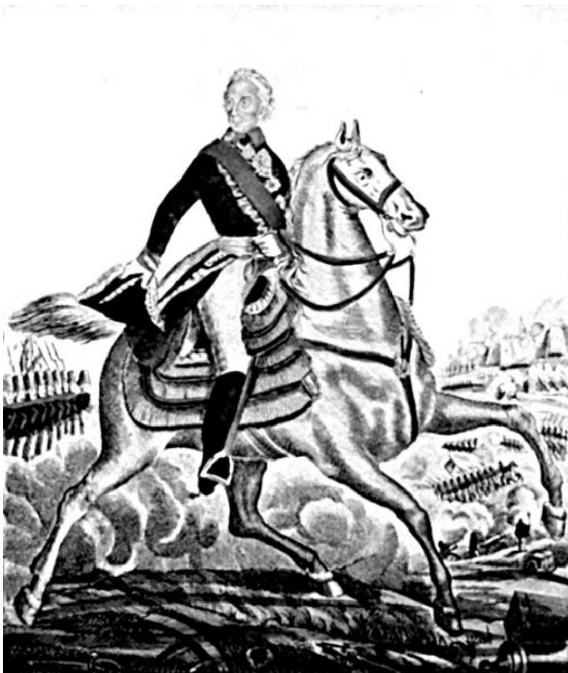
Лубочный образ А.В. Суворова

Здесь в ходе Семилетней войны начинает складываться боевой стиль будущего полководца: тотальная продуманность боя, быстрое и решительное осуществление своего замысла. Причем настолько быстрое и решительное, что фактически неожиданное для противника. Иными словами, противник, возможно, и ожидал, что Суворов нагрянет именно отсюда, но никогда не ожидал такой скорости и такой силы удара. Суворов рискует, но всегда рискует оправданно, не пробует, не пытается, не старается, а тщательно готовит и наносит молниеносный удар, предпочитая холодное оружие (штыки или сабли).