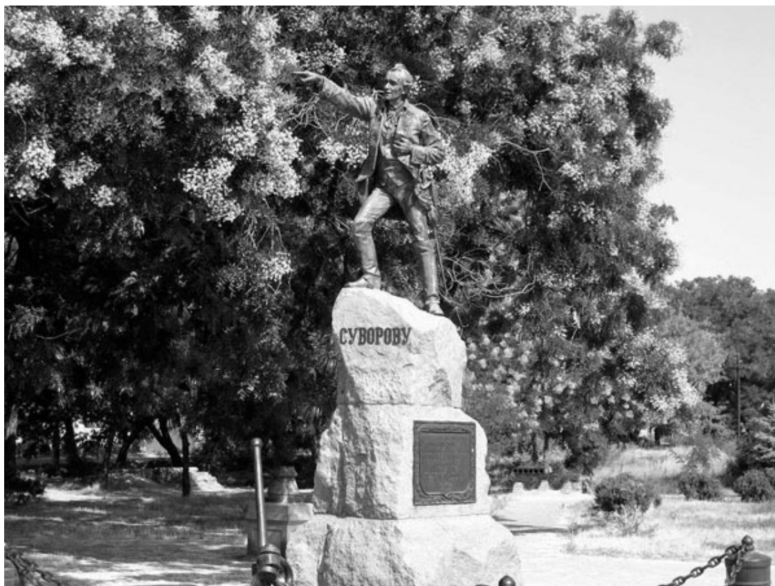
Памятник А.В. Суворову, г. Очаков (Украина)

Императрица Елизавета Петровна умирает в 1761 году, и на престол восходит Петр III (или, как его называла Елизавета, «чертушка»). Война тут же заканчивается. Все завоеванные земли вместе с Кенигсбергом и живущим в нем Иммануилом Кантом (уже успевшим присягнуть Елизавете) возвращаются Фридриху. Россия и Пруссия заключают договор о дружбе. Суворов отзывается в Петербург и застрелен в состоянии неопределенности. Править, однако, Петру III пришлось недолго, разгневанная гвардия не может простить ему ни предательского мирного договора, ни устанавливаемых в русской армии прусских порядков. В 1762 году в результате переворота на трон восходит Екатерина II, прозванная позже Великой. В ходе переворота отличился отец Александра Василий Иванович Суворов, который без единого выстрела разоружил голштинцев – личную охрану императора Петра III. Екатерина не забывала друзей, ходатайство Румянцева полугодовой давности, наконец, удовлетворяется, и Александр Васильевич становится полковником сначала Астраханского, а потом и Суздальского полка. Начинается эпоха (я не побоюсь этого слова) военного строительства. Суворов еще сравнительно молод – 33 года, но уже постиг воинскую науку на личном опыте, а многое перенял у выдающихся военачальников Фремора, Берга, Румянцева. Познакомился он в бою и с хваленной прусской системой, на опыте познав ее достоинства и недостатки.