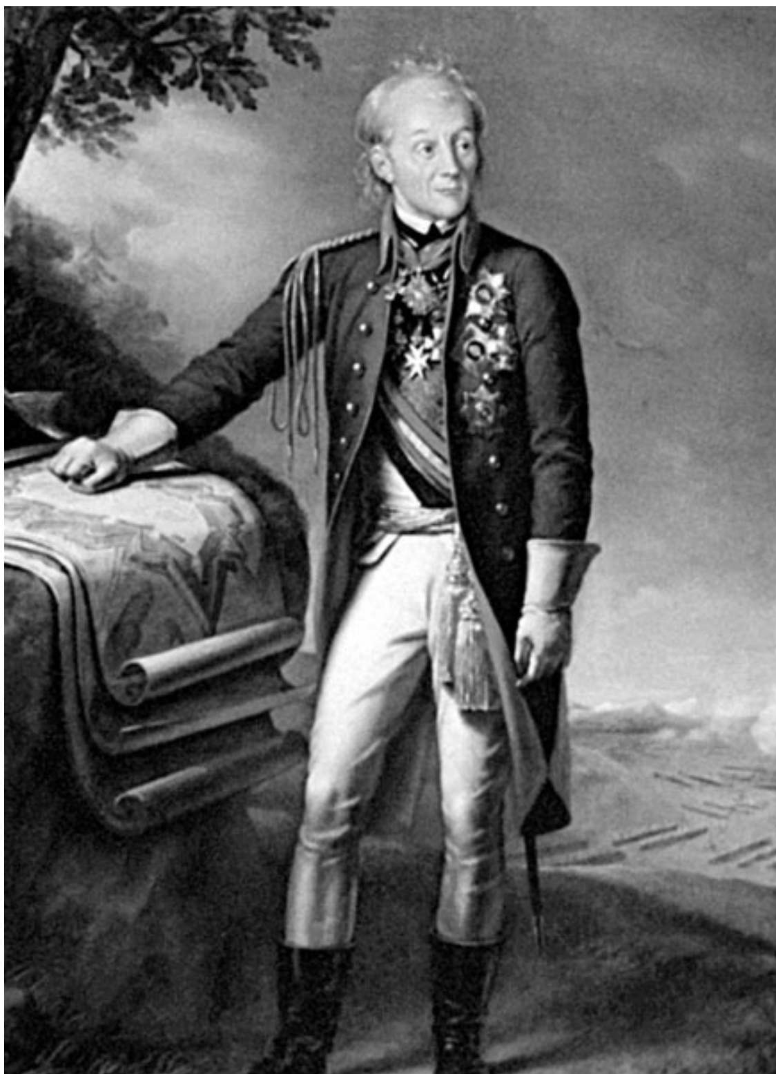
Суворов у карты военных действий. Художник К. Штейбен. 1799 г.

Важно отметить, что кроме постоянного профессионального совершенствования Суворов активно работает над моральным духом подчиненных: религиозность, патриотизм, безупречная нравственность, все служит этой цели. Он буквально взращивает, культивирует победный дух своих войск, строго пресекая любые проявления мародерства, жестокости и насилия к местному населению. Обиженное самолюбие поляков и французов произвело на свет божий бесчисленное количество разного рода пасквилей, рисующих кровожадность Суво-