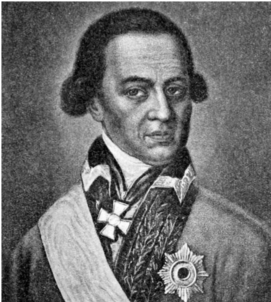
Абрам Петрович Ганнибал

Конфликт живого и технологического (машинообразного) в настоящее время достигает своего апогея. И от того, какой путь развития мы, в конечном итоге, выберем, зависит не только и не столько успешность бизнеса, сколько судьба самого человечества. Очень хотелось бы, чтобы человечество выбрало жизнь, живое, и яркой путеводной звездой на этом пути нам могут служить жизнь, судьба и управленческая система Александра Васильевича Суворова.