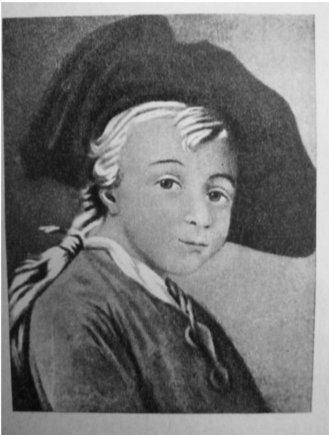
Портрет А.В. Суворова в детстве. Неизвестный художник

Саша тоже не сдаётся, для себя он уже твердо решил – он станет великим полководцем, и его военная слава превзойдет славу Цезаря. Для этого ему нужно: 1) укрепить здоровье, и он разрабатывает сам для себя особую систему физических упражнений и закаливания посредством обливания холодной водой (2 ведра утром, 2 ведра вечером); 2) изучить всю известную в его время литературу по военному делу, и он продолжает усердно изучать военные труды Петра I, Герцога Мальборо, Фридриха Прусского и других выдающихся полководцев. И третий, пожалуй, самый интересный пункт, – познать душу русского солдата. Возможности осуществить данный пункт у него пока нет, но внутренне к его осуществлению он уже готов.