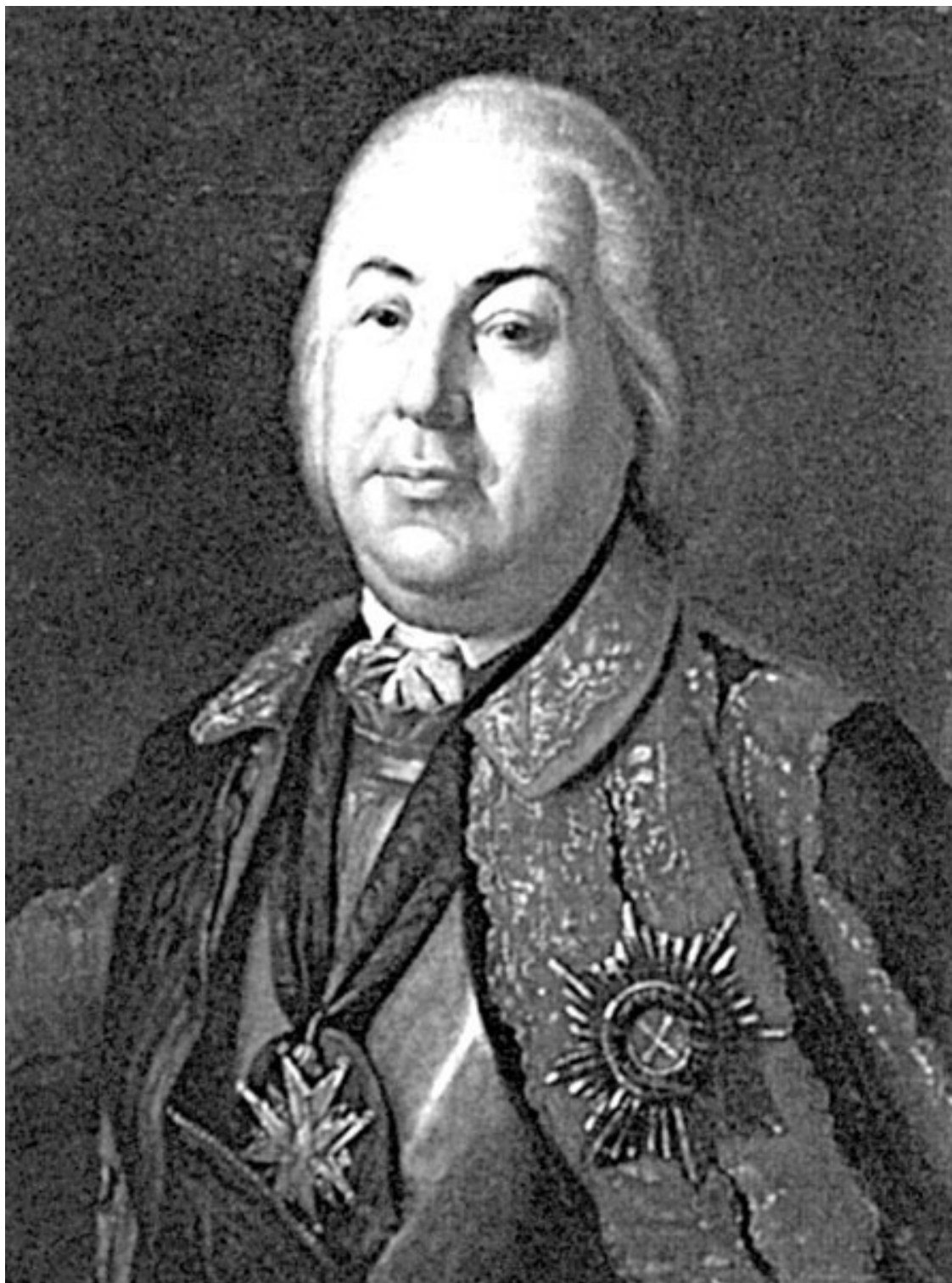
Петр Семенович Салтыков

чине выведен из строя, брать командование на себя. Опять божий промысел направляет судьбу нашего героя, будучи всего лишь подполковником, он имеет возможность учиться воинскому искусству на целом театре военных действий.