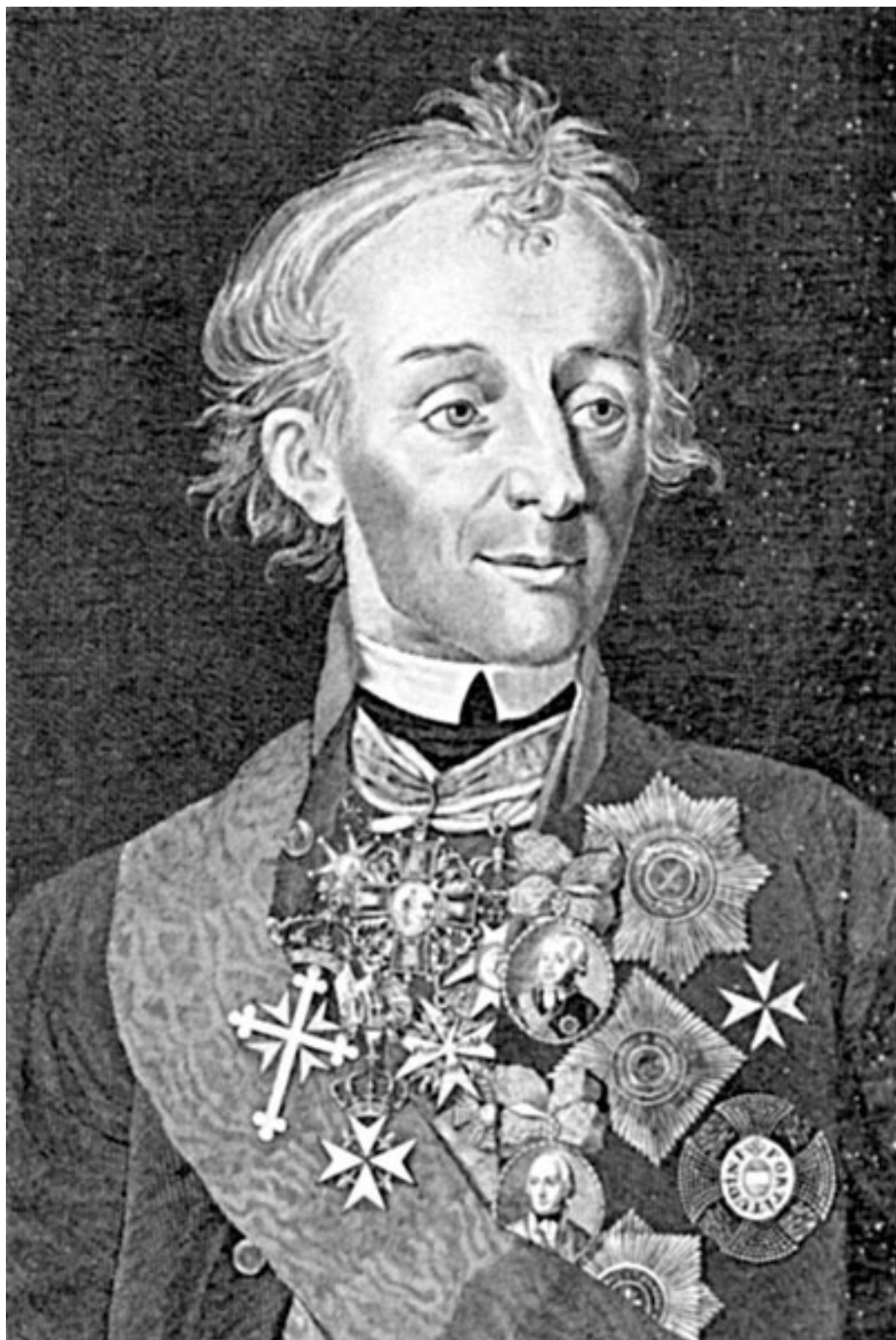
А.В. Суворов. Гравюра А. Флорова