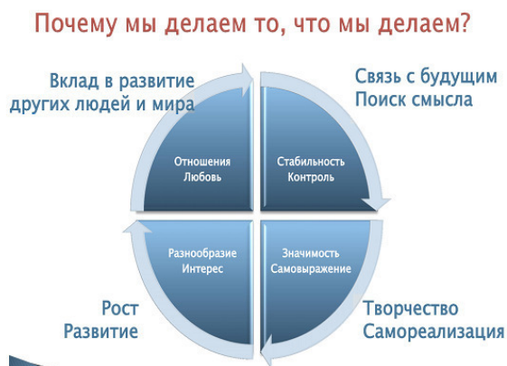
рис. 2 Личностные и Духовные потребности. Связь между ними.

Ответьте искренно, было ли когда-либо, что вы создали что-нибудь, и потом сказали: «Да, это похоже на меня!»