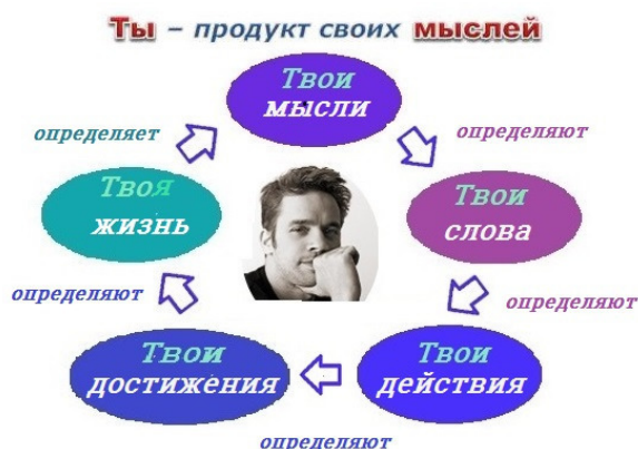
рис. 3 Ты – продукт своих мыслей.

«САМУРАИ ГОВОРЯТ: ПЕРЕД БИТВОЙ ВСЕГДА ДУМАЙ О ПОБЕДЕ. И УДАЧА УЛЫБНЕТСЯ ТЕБЕ!»