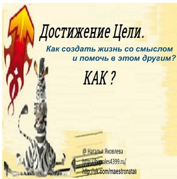
рис.1 Достижение Цели. КАК?

Сегодня я решила предложить Вам тему «Достижение цели. КАК?»