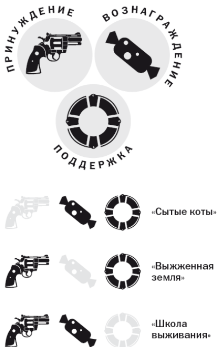
Векторная диаграмма регулярного менеджмента (поле мотивации)

Сотруднику с мотивацией избегания нужно не только принуждение, но и вознаграждение. Кстати, не стоит списывать людей с такой мотивацией со счетов. Довольно часто ответственность и организованность появляются у человека не «от рождения», а именно как следствие нежелания неприятностей. Понимая последствия необязательности и желая их избежать, человек учится быть точным. И что в этом плохого? Так вот, разве сотруднику с такой мотивацией не нужно справедливое вознаграждение? Другой вопрос, что вовсе не вознаграждение является тем мотивом, который обеспечивает нужные параметры работы, но оно необходимо, как и поддержка.