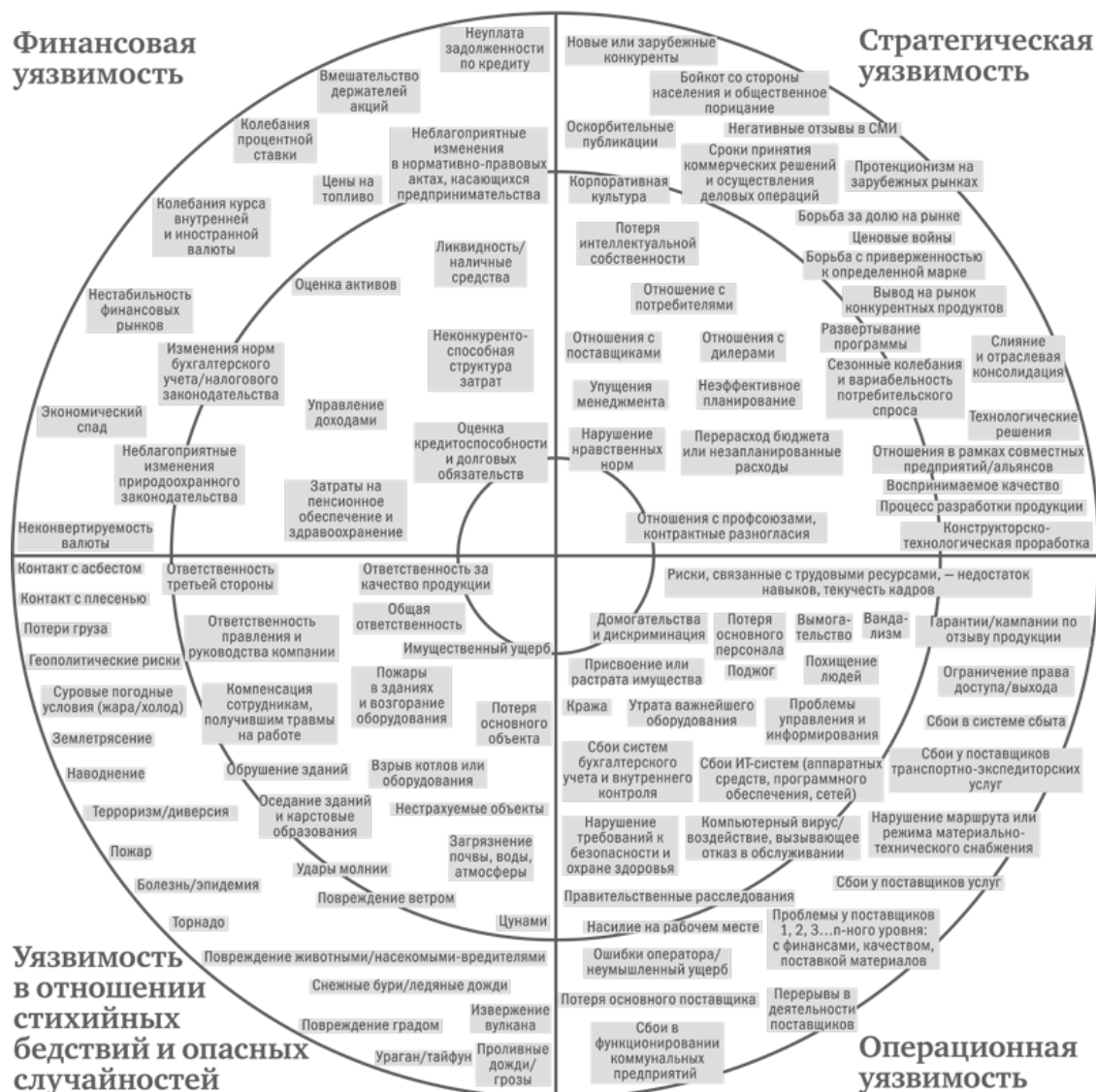
Рис. 2.3. Концентрическая карта уязвимости

Менеджеры цепочки поставок ГМ уделяют основное внимание двум нижним секторам: уязвимости в отношении стихийных бедствий и опасных случайностей и операционной уязвимости. Операционная уязвимость касается всего, что связано с ущербом средствам производства, начиная от сбоев в работе поставщика, до краж, совершаемых сотрудниками. Уязвимость в отношении стихийных бедствий и опасных случайностей связана как со случайными воздействиями (которые могут быть вызваны суровыми погодными условиями, землетрясениями или несчастными случаями); так и с умышленным вредительством, в том числе международным терроризмом и фальсификацией продукта. Финансовая уязвимость отражает широкий спектр макроэкономических и внутренних финансовых проблем от колебаний обменного курса валют до снижения рейтинга кредитоспособности и ошибок в финансовой отчетности. (Разумеется, любой из факторов риска на этой карте может негативно сказаться на финансах, но здесь основной акцент делается на сбоях, которые порождает рынок, экономика или промахи в управлении финансами в самой ГМ.) Стратегическая уязвимость относится к негативным событиям, которые можно предотвратить, избрав правильную стратегию – от появления новых конкурентов за рубежом до бойкотов населения и внутреннего нарушения нравствен-