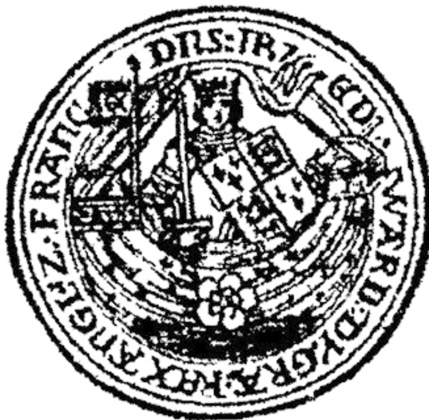
Рис 3. Нобль короля Эдуарда

Монеты из этого металла в свое время находились в обращении, им верили, принимали в оплату. Отличало их лишь одно – алхимические символы, изображенные на них. Такая символика есть на золотых монетах английского короля Эдуарда III (1327–1377). Монета называлась «нобль», что означает «благородный». Считается, что это самая первая известная монета из алхимического металла.