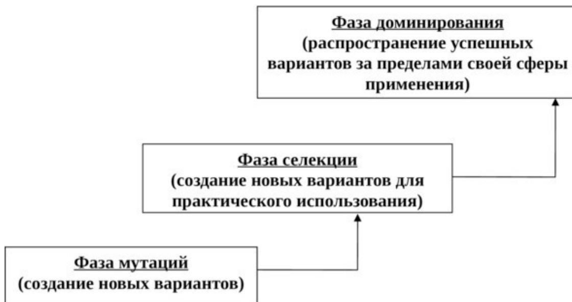
Схема процесса развития науки по С.Тулмину

Можно добавить, что основная часть приведенного в данной работе исследования посвящена новейшей истории – XV – XXI векам. Соотношение науки в других культурах и на других исторических отрезках было несколько отлично. Нужно помнить о том, что техника действительно долгие столетия развивалась исключительно как ремесло, а наука как элитарное, обособленное от практики времяпрепровождение. Многие тысячелетия, например, обработка металла и врачебное искусство развивались без какой-либо связи с наукой. Положение изменилось лишь в последнее столетие, когда техника и промышленность действительно были революционизированы наукой. Но это не означает, по мнению Тулмина, что изменилась сама сущность техники, но лишь то, что новое, более тесное партнёрство техники и науки привело к ускорению решения технических проблем, ранее считавшихся неразрешимыми. Можно добавить только, что связи между любыми отраслями знания со временем растут и развиваются. И от чистой философии, чистого умозрительного анализа человеческая мысль постоянно шагает в направлении практического применения.