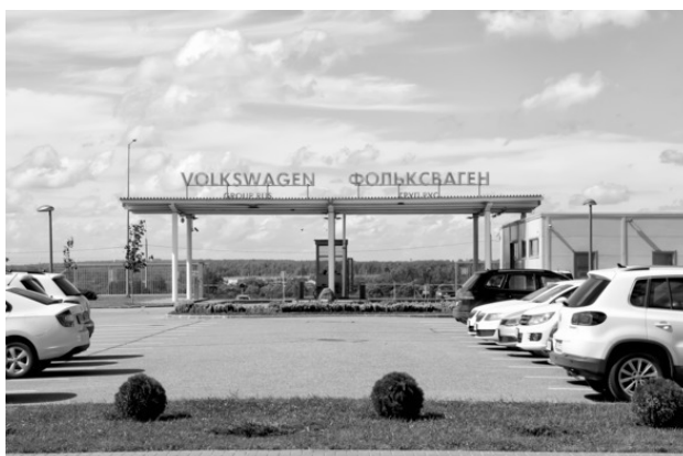
Проходная завода VW-Skoda в калужском Грабцево

– Мы сфокусированы на Калуге. Есть площади, которые позволяют увеличить производственную мощность вдвое. Территория завода это позволяет. Ведем переговоры с «ГАЗом». Пока нет необходимости в поиске других площадок.