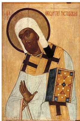
Леонтий Ростовский (икона середины XVI века)