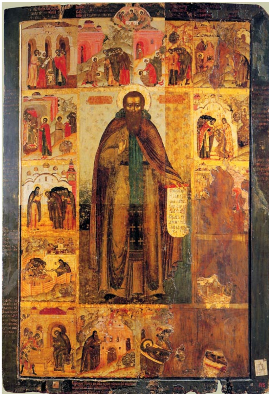
Преподобный Феодосий Печерский с житием в 14 клеймах (икона XVII век)

Новгородская вторая, Новгородская четвертая и Никоновская летописи указывают, что Феодосий в 1055 год был игуменом Печерским.