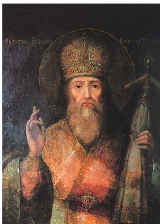
Ефрем, митрополит Переяславля Южного

Согласно Лаврентьевской летописи за 1089 год имеется запись о церковном строительстве Ефрема в Переяславле и краткие внешние данные Ефрема: «Въ льто 6597... Въ се же льто священа бысть церкы святого Михаила Переяславская, Ефремомъ митрополитомъ тоя церкы, южа бѣ создалъ велику суицю, бѣ бо прежде въ Переяслави митрополья, и пристрои ю великою пристроею, украсивъ ю всякою красотою, церковными съсуды. се бо Ефремъ бѣ скопецъ, высокъ тѣлом. бѣ бо тогда много зданья въздвиже...» 70 . Это подтверждают Ипатьевская, Новгородская четвертая летописи и Летопись по Воскресенскому списку .