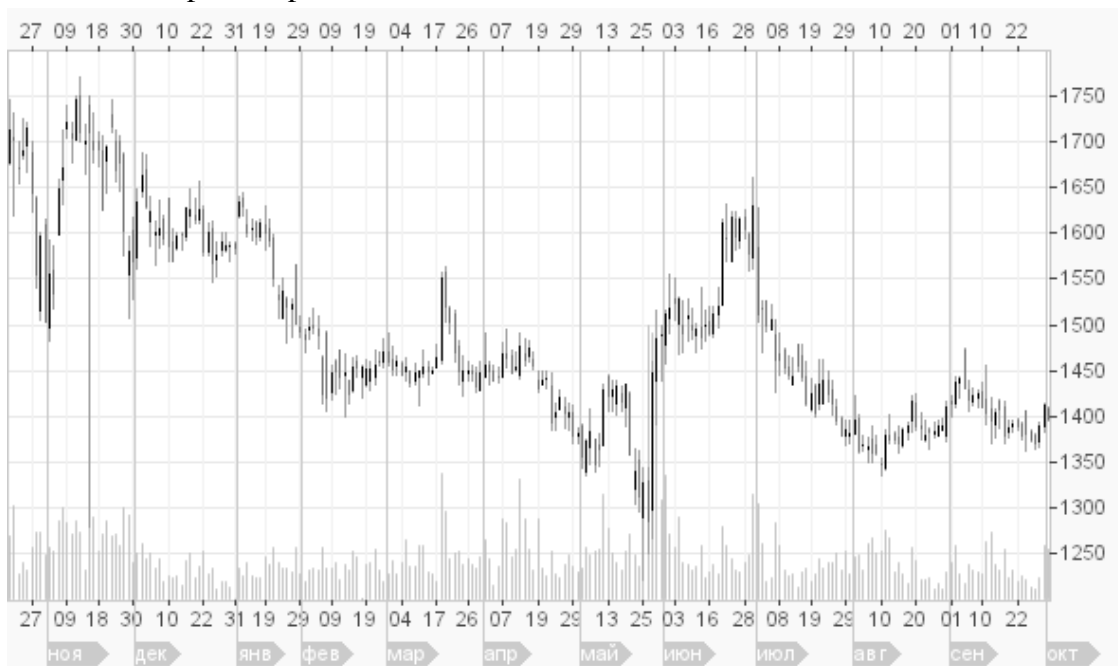
Рис. 2 График изменения цены акции ОАО «Полюс Золото» в течение года

Срок инвестирования: 12 месяцев. График изменения цены ОАО «Полюс Золото» в течение этого периода представлен на Рис. 2.