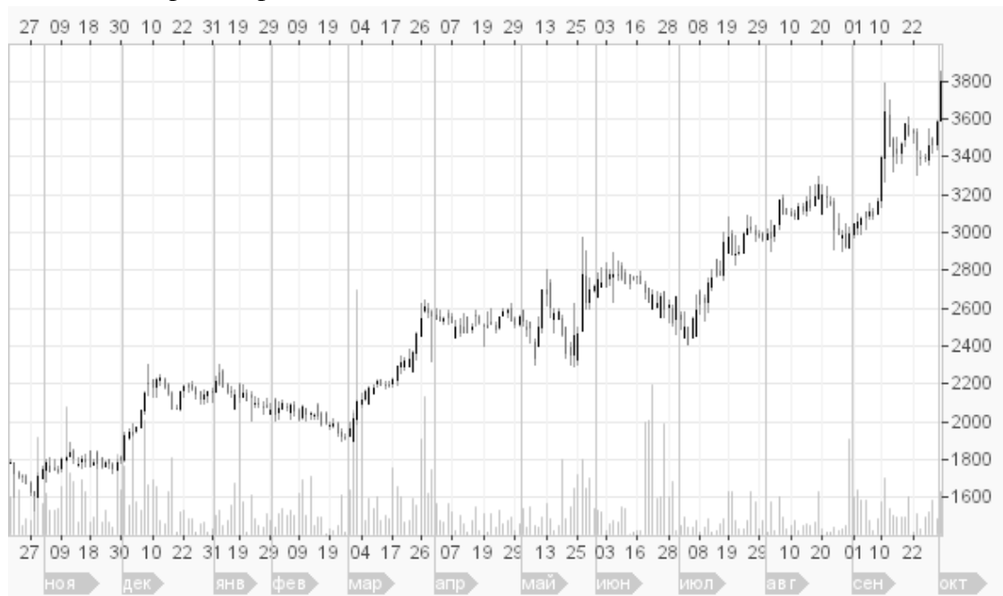
Рис. 1. График изменения цены акции ОАО «Магнит» с октября 2009 по октябрь 2010 года

Срок инвестирования: 12 месяцев. (График изменения цены на акции ОАО «Магнит» в течение этого периода времени показан на Рис. 1).