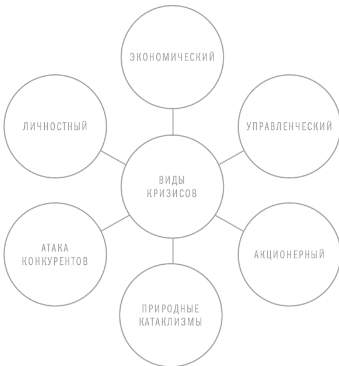
РИСУНОК 2. Разновидности кризисов, рассматриваемых в этой книге

Любой из этих видов кризисов – это инструмент, нацеленный на починку испорченного механизма внутри компании и являющийся частью системы саморегуляции компании, частью ее повторяющегося цикла развития. Период роста или процветания компании рождает у ее лидера чувство самоуспокоенности и тщеславия, и он часто забывает, что следующая стадия – кризис.