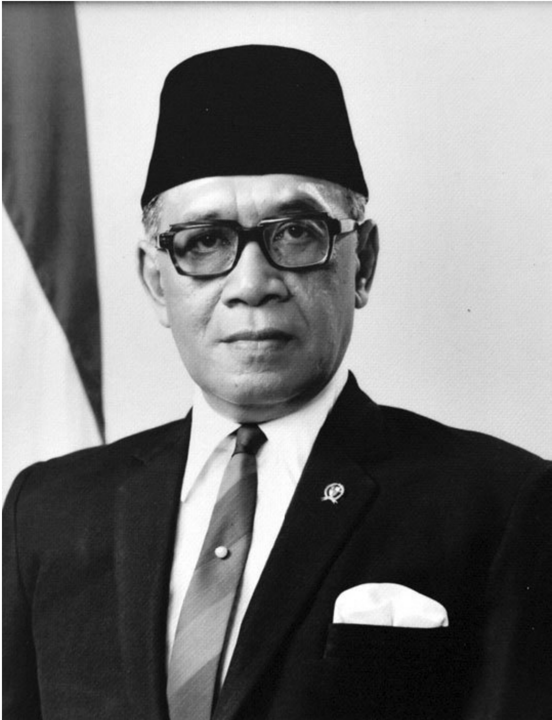
Президент Индонезии Сухарто

Ведущий: А разве у них не было, по крайней мере, своих экспертов, которые могли бы сами составить экономические прогнозы и понять, что то, что вы обещали, было нереальным?