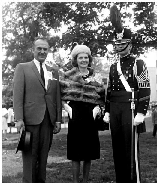
Дональд Трамп со своими родителями – Фредом и Мэри

В 1922 году Фред окончил среднюю школу, но, поскольку надо было обеспечивать семью, будущий отец Дональда не мог позволить себе продолжить образование и устроился помощником плотника к подрядчику, строившему жилые дома в Куинсе. У Фреда всегда были умелые руки, и, кроме того, для новичка в строительстве он был весьма смелым парнем. Даже в глубокой старости отец Дональда был способен складывать в уме до пяти колонок чисел, никогда не ошибаясь и легко запоминая все результаты.