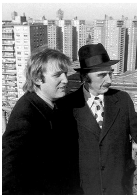
Строительные магнаты: Дональд и Фред Трампы

Дональд наблюдал за отцом, когда тот общался с подрядчиками, представителями профсоюзов, удивляясь, как он может извлекать максимальную выгоду из каждого строительного участка. Отличительным почерком Фреда Трампа стало добавление к каждому построенному им зданию какой-нибудь приманки, например, он одним из первых стал строить в Бруклине дома со встроенными гаражами. Кроме того, когда было необходимо, Фред превращался в настоящую звезду бруклинских газет: все первые полосы были забиты информацией об очередном торжественном мероприятии, организованном Трампом при открытии нового объекта. Дело было даже не в рекламе, секрет был прост: Трампы добивались задуманного лишь потому, что строили лучшие здания в лучших местах, опираясь на наиболее востребованные целевой аудиторией варианты. Фред Трамп учил Дональда общаться с профсоюзами и политиками, чтобы строить, не превышая смету и опережая проектные сроки. А уж потом, после завершения строительства, когда оказывалось, что очередное здание завоевало заслуженный успех, окружающим казалось, что это грандиозный промоушен. На самом же деле обретенный успех был продуктом хорошо выполненной работы.