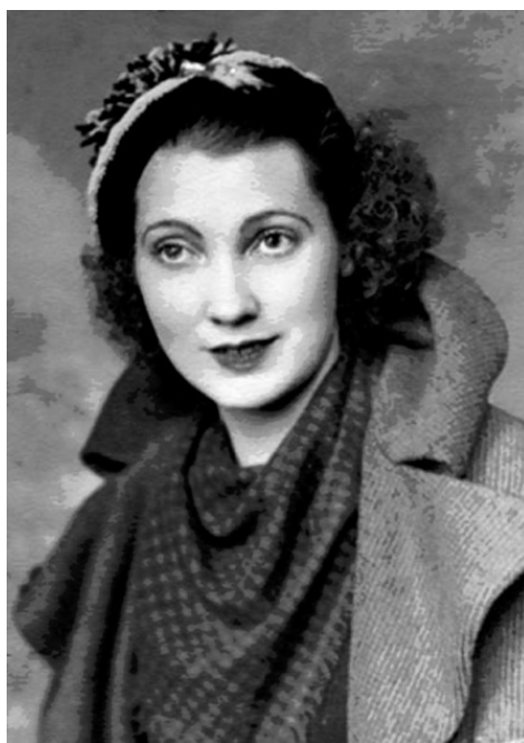
Мэри Энн Маклеод Трамп – мать Дональда Трампа

В отличие от своего старшего брата и многих других подростков, Дональд рано заинтересовался бизнесом. Тем самым он избежал давления со стороны отца, – напротив, Фред только поощрял его. Отношения между Дональдом и Фредом были больше деловыми, чем семейными, и строились на взаимном уважении.