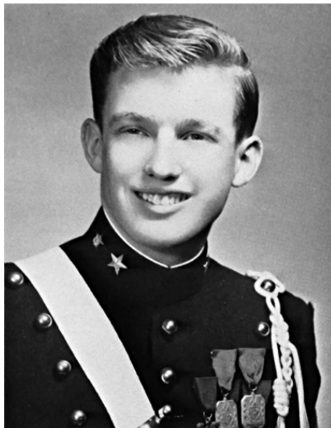
Дональд Трамп в форме Военной академии

Даже на сегодняшний день дома Фреда Трампа в Бруклине и Куинсе остаются в Нью-Йорке самым удобным жильем, которое можно получить за умеренную цену.