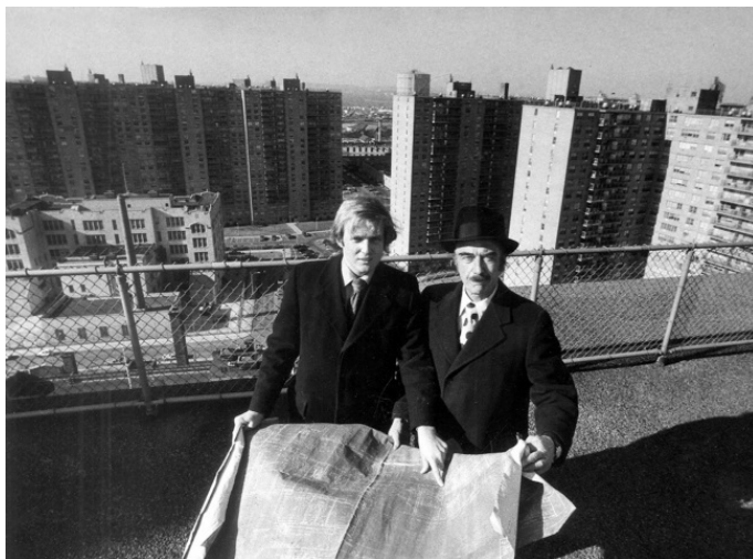
Дональд и Фред Трампы. 1973 год. Последний проект Фреда в Квинсе

На деле люди из «Благоразумия» должны были проявить больше этого самого благоразумия. Излишняя торопливость их подвела. К тому моменту, когда сделка была завершена, в «Свифтоне» были десятки пустых квартир. Цена сделки составила 12 миллионов долларов, и на ней Трампы заработали 6 миллионов долларов.