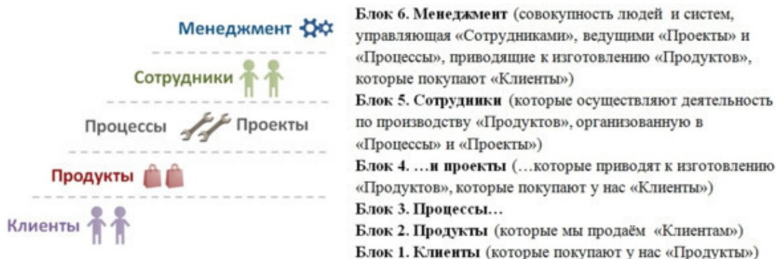
Рис. 2. Клиенты – Продукты – Процессы/Проекты — Сотрудники – Менеджмент

Для диагностики подойдёт следующая структура ( будьте внимательны: читается снизу вверх ):