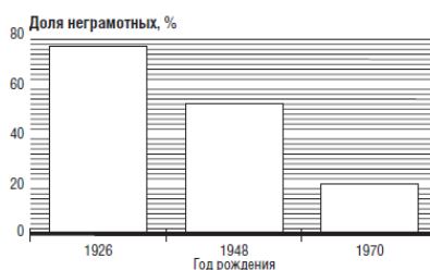
Рисунок 4. Распространение грамотности в развивающихся странах