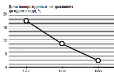
Рисунок 2. Снижение уровня младенческой смертности