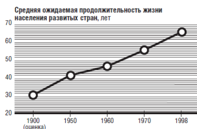
Рисунок 1. Рост средней ожидаемой продолжительности жизни

Улучшение условий жизни людей по всему миру проявляется и в резком увеличении средней ожидаемой продолжительности жизни. В начале XX века в нынешних развивающихся странах этот показатель не достигал и тридцати лет; к 1960 году вырос до 46 лет, а в 1998-м составил 65 лет.