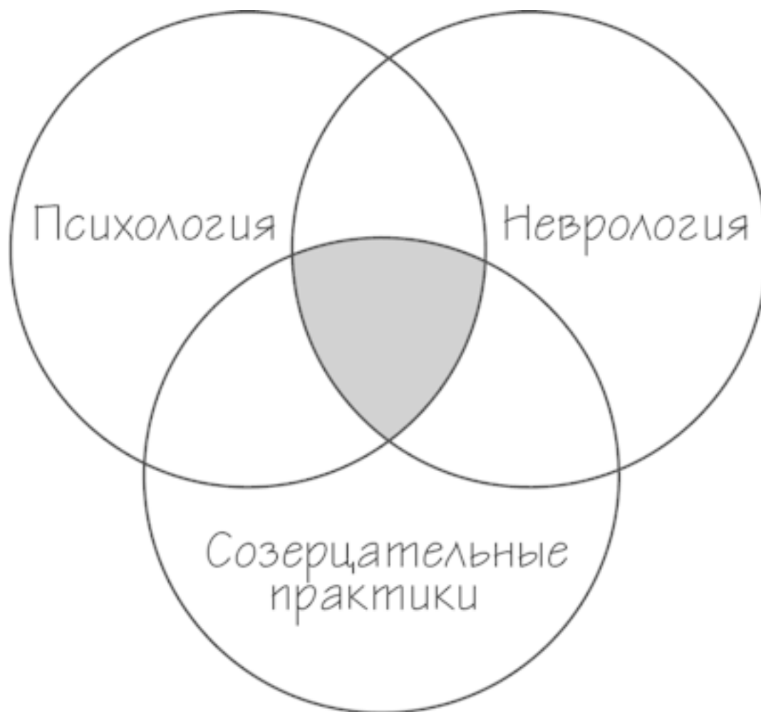
Рис. 1. Взаимное пересечение трех дисциплин

виды деятельности можно назвать путем пробуждения . И мы стремимся с помощью нейробиологии помочь вам с легкостью пройти этот путь.