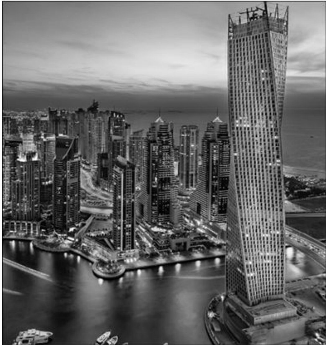
Рис. 1. Ассоциации Instagram

Конечно, это достаточно субъективное восприятие, хотя когда я показываю этот слайд на своих выступлениях, то большая часть аудитории согласна с моими ассоциациями. И тот срез YouTube, с которым я вас познакомлю, – тоже мой личный взгляд на вещи, который может совпасть с вашим, а может отличаться.