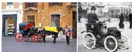
Рисунок 4. Первый автомобиль Луи Рено. Не правда ли он очень похож на коляску?

Автомобиль – немного измененная карета, в которую устанавливается двигатель внутреннего сгорания (или электрический двигатель). Обратим внимание на то, что и карета была известна, и двигатель внутреннего сгорания 11 вышел на второй этап развития. Но новая система обладала более высокими потребительскими качествами по сравнению с обычной каретой. Именно поэтому и появилась новая величайшая S-кривая – автомобили.