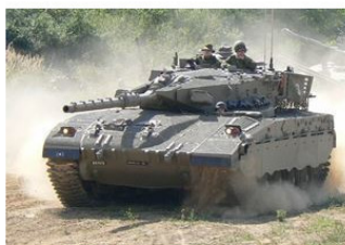
Рисунок 15. Танк Меркава 1

В израильских танках «Меркава» установлены кондиционеры. Эта система позволяет воевать более эффективно в условиях жаркого климата Ближнего Востока.