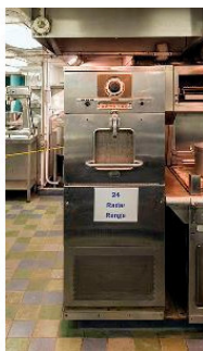
Рисунок 12. Первая серийная микроволновая печь весила 340 килограмм и использовалась в ресторанах