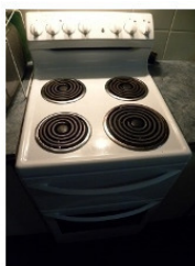
Рисунок 14. Электроплита с конфорками разного размера

Размер конфорок электроплиты согласовывается с диаметром дна кастрюлек, в которых готовится пища.