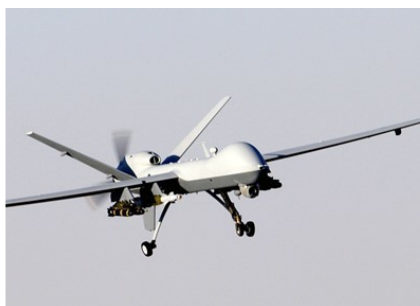
Рисунок 6. Современный ударный беспилотник MQ-9 Reaper, 2007 год

Как это ни парадоксально, но такие значимые с точки зрения человечества новые технические системы, как автомобиль, реактивная авиация, не что иное как «простая» удачная замена одной из важных подсистем в технической системе, на качественно более совершенную. И эта замена выполнена в соответствии с известными законами развития технических систем. Они не являются пионерными системами! То есть в классификации ТРИЗ – это ГИБРИДИЗАЦИЯ ТЕХНИЧЕСКИХ СИСТЕМ.