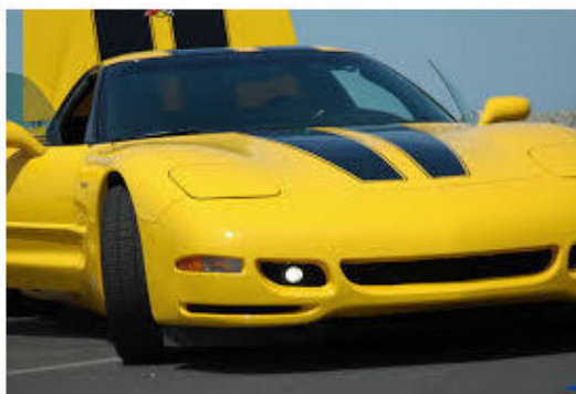
Рисунок 13. Динамичные фары

– согласование ритмики работы системы , ее характеристик и т. п.