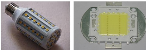
Рисунок 3. LED-светильник с множеством элементов; один из элементов

отраслях, например, новых способов выращивания овощей в многоуровневых теплицах и многие другие.