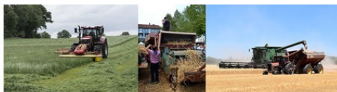
Рисунок 8. Косилка и молотилка были объединены в комбайн

В современном комбайне объединены две системы – косилка и молотилка. Но у них общий двигатель, шасси с колесами и многое другое. А технология такова, что одновременно выполняются две операции. И все это делает один человек!