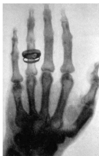
Рисунок 2. Первый рентгеновский снимок – рука Альберта фон Кёлликера, 21.01.1896 года

отраслях, например, новых способов выращивания овощей в многоуровневых теплицах и многие другие.