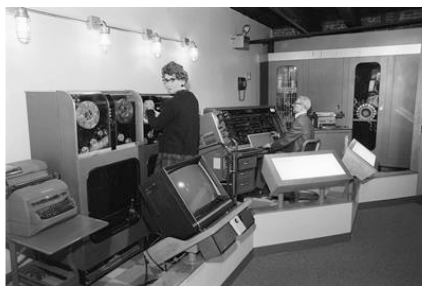
Рисунок 9. Первый компьютер IBM

Но, в какой-то момент, программисты начали использовать компьютеры для печати картинок символами. Идея была подхвачена и вскоре на компьютере стали печатать тексты, а еще через некоторое время у компьютеров появилась масса новых применений. Теперь математические вычисления – один из узких рынков из всех применений компьютеров. Разумеется, и сама система при этом претерпела существенные изменения.