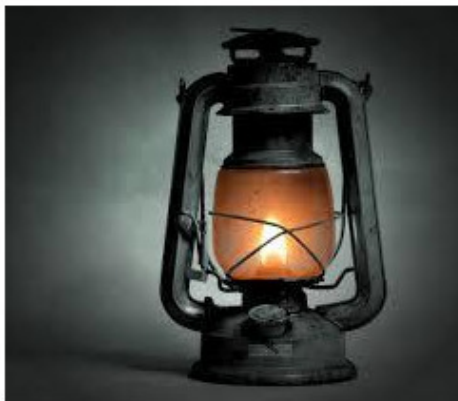
Рисунок 7. Керосиновая лампа

ограниченный ресурс). То есть система совсем не пионерная, и изменения не очень значительные, но изменение доступности топлива позволило резко расширить рынки. Ее появление радикально изменило общества. Клерки смогли увеличить рабочий день (особенно в зимнее время), повысились возможности образования (студенты и учёные получили возможность читать в вечернее время), работники получили возможность работать на предприятиях и мануфактурах в темное время суток, продавцы – продавать товары и т. д.