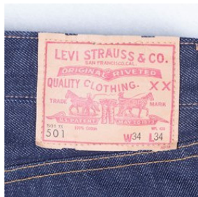
Рисунок 10. Фирменная этикетка Леви Страусс

лась. Предприимчивый Страусс сообразил, что парусина может быть использована по другому назначению, и начал шить из привезенной парусины штаны. Это и были первые джинсы! Неожиданно новая одежда стала пользоваться большим спросом. В 1873 году он с Джекобом Девисом получил патент на «Комбинезон без верха», и учредил компанию «Леви Страусс».