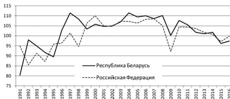
Рис. 1.1. Динамика ВВП (в постоянных ценах), в % к предыдущему году

Проблемы Российской Федерации в экономическом плане были обусловлены спецификой либеральных подходов. Гайдаровская команда предложила трехлетнюю программу стабилизации российской экономики на базе рынка. На первом этапе предполагались открытый рынок, борьба с дефицитом и ликвидация очередей (за счет обнищания населения. – А. Л.), на втором этапе ожидалась остановка инфляции (если денег у населения не будет, то и инфляция спроса прекратится. – А. Л.). А на третьем этапе предполагался экономический рост «на основе частных сбережений, частных инвестиций» [3, с. 2]. Но в условиях стагнирующей экономики сложно было надеяться на частные сбережения бедного населения. Поэтому либералы сделали упор на олигархические структуры с нерациональной структурой личного потребления и экспорт полезных ископаемых. Экспорт нефти и нефтепродуктов из России увеличился с 51,7 млрд в 1992 г. до 105,0 млрд долл. США в 2000 г., т. е. за 8 лет более чем в 2 раза [3].