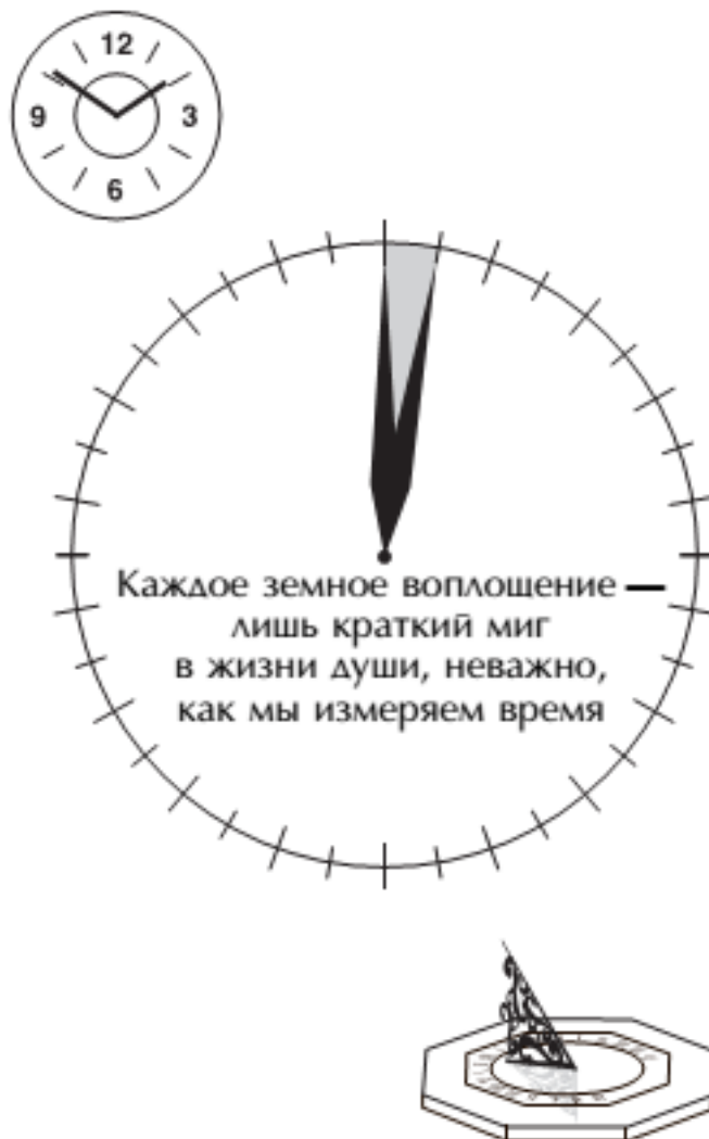
Рис. 3. Время

Цель наших реинкарнаций – возвысить характер наших личностей, усовершенствовать их, научиться в полную силу пользоваться энергией души. Благодаря этому мы становимся хозяевами своего процесса развития и участвуем в творении мира посредством сил любви и воли.