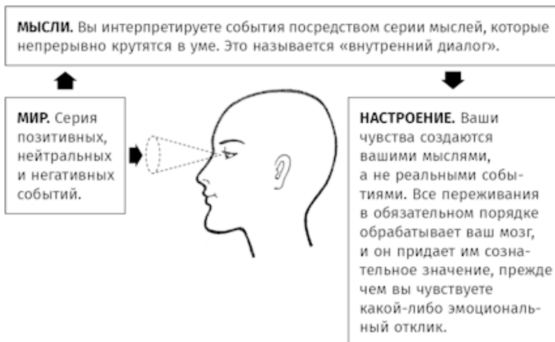
Рис. 3.1. Отношения между событиями окружающего мира и тем, как вы себя чувствуете. Не реальные события, а именно ваше восприятие приводит к изменениям настроения. Когда вы грустите, ваши мысли будут казаться реалистичной интерпретацией негативных событий. Когда вы в депрессии или встревожены, мысли всегда будут нелогичными, искаженными, нереалистичными или просто ошибочными

Если ваше понимание происходящего достоверно, то и эмоциональное состояние будет в норме. Если восприятие изменено или каким-либо образом искажено, то и эмоциональный отклик будет иметь искажения. Депрессия – как раз пример такого случая. Это всегда результат «статических» умственных искажений. Ваше дурное настроение можно сравнить с помехами, возникшими от того, что радио плохо настроено на частоту. Проблема не в том, что лампы или транзисторы перегорели или неисправны или что сигнал радиостанции искажается из-за плохой погоды, – просто нужно настроить частоту. Когда вы научитесь выполнять эту ментальную настройку, музыка снова станет четкой и в вашем состоянии наступят улучшения.