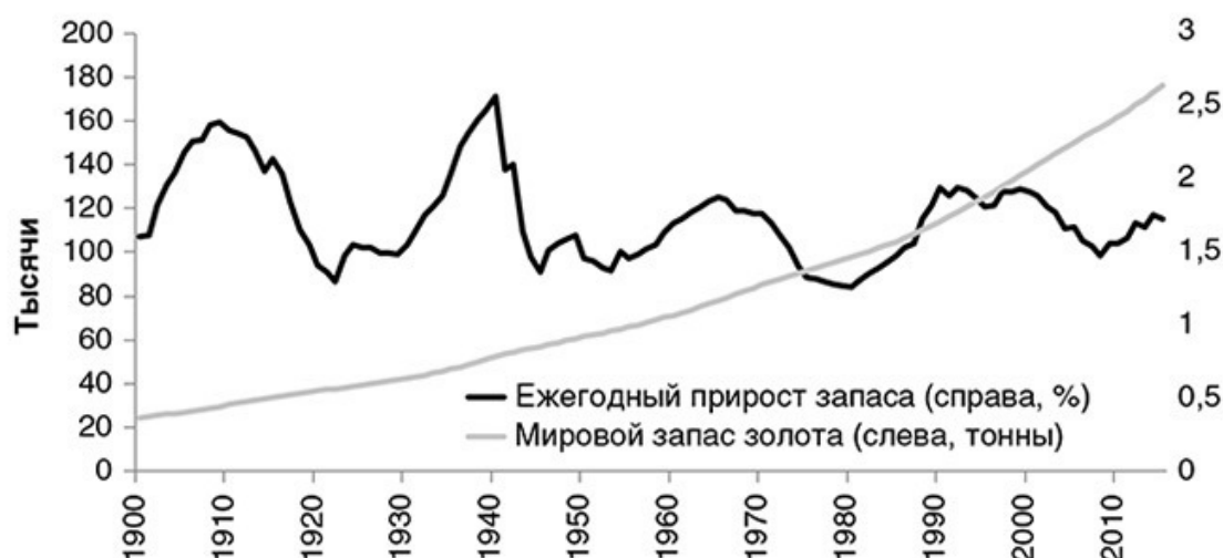
Рис. 1. Мировой запас золота и размер ежегодного прироста 15

Чтобы лучше понять отличие золота о любого потребительского товара, давайте представим, какой эффект производило бы резкое повышение спроса, ведущее к росту цен и удвоению годового производства. В случае потребительских товаров удвоенный приток быстро превзойдет объем имеющегося запаса, в результате чего цены рухнут, а держатели резервов потеряют свои вложения. Что касается золота, то скачок цен вследствие удвоения годового производства будет незначительным, то есть с 1,5 до 3 процентов. При сохранении новых объемов производства запасы будут расти быстрее, что сделает дальнейшие повышения менее существенными. Но для золотодобычи такой сценарий неприемлем, ее объемы и темпы до сих пор не позволяют ощутимо влиять на рынок.