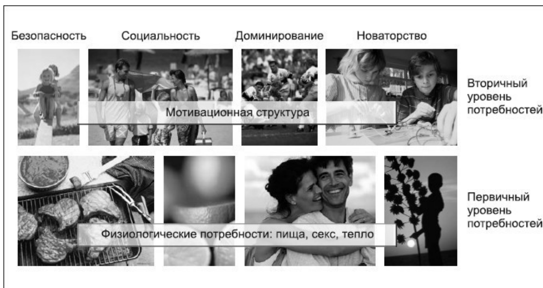
Рис. 1. Мотивационная структура человеческой психики

Разные группы потребителей имеют различную преобладающую мотивацию. Некоторые люди склонны к сильному проявлению привязанности, у них ярко выражен социальный мотив. Другие стремятся к власти, им ближе такие эмоциональные мотивы, как лидерство, успех, сексуальность. Интересно, что в крови у властных личностей отмечается значительно более высокий уровень тестостерона, чем у людей без желания доминировать (рис. 1).