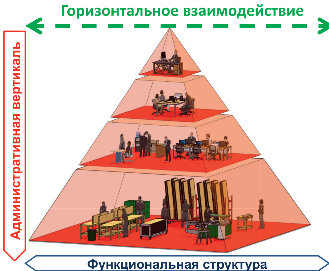
Илл. 2. Структура организации

Позволю себе предположить, что в большинстве компаний руководитель не видит картинку целиком, поскольку есть элементы системы управления, но нет их взаимосвязи. Мы все знаем об этих элементах, но почему-то не думаем о том, что это составные части СИСТЕМЫ управления для достижения компанией запланированных результатов.