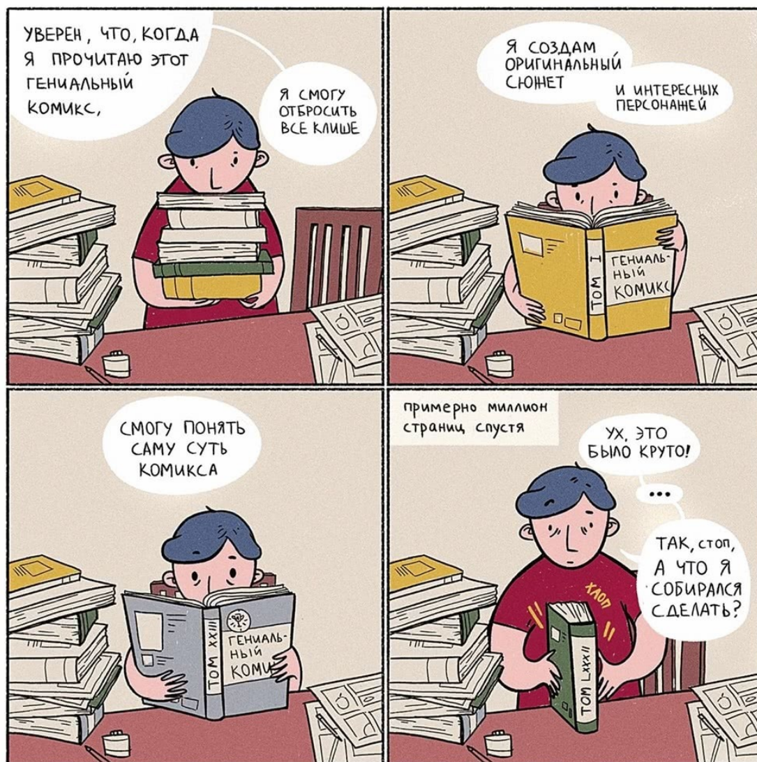
Стрип Иры Бобровской

В Санкт-Петербурге работает бесплатная Школа комиксов «Палитра» для участников от 14 до 30 лет. По словам куратора Ксеньи Панкиной , курс на два семестра читают художники, сценаристы, издатели.