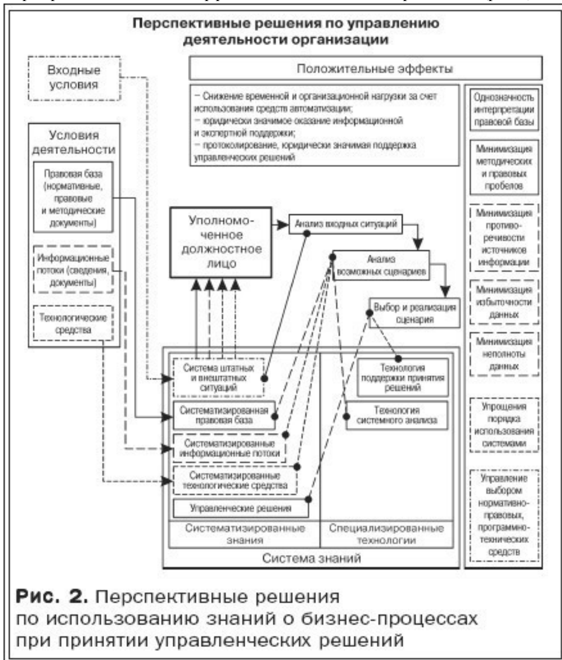
Рис. 2. Перспективные решения по использованию знаний о бизнес-процессах при принятии управленческих решений

♦ создание методологической и технологической основы для поэтапной оптимизации (реинжиниринга) организации, позволяющей производить технико-экономическую оценку мероприятий по модернизации, выявлению организационных, функциональных и технологических резервов для повышения эффективности деятельности организации (рис. 2).