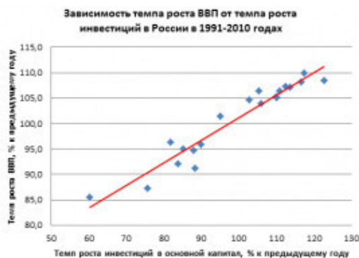
Рис.1.1. Зависимость темпа роста ВВП от темпа роста ИОК.

МАТЕМАТИЧЕСКАЯ МОДЕЛЬ РОСТА ВВП Y - % темпа роста ВВП (ТР ВВП) = X - % темпа роста ИОК (ТР ИОК) * 0,432 + 57,58.