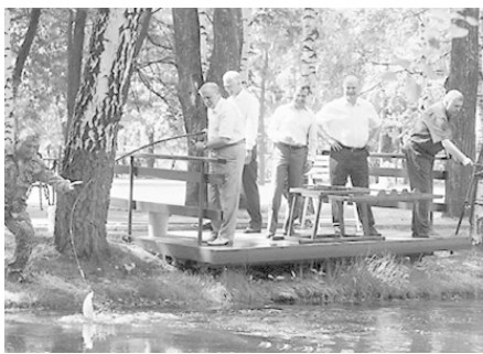
Главные политические «рыбаки» России на совместной рыбалке в резиденции Д. Медведева