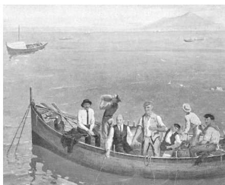
В. Ленин и А. Горький с рыбаками на о. Капри. Картина, художник Е. М. Чепцов

Эти слова Председателя правительства молодой Советской России Владимира Ульянова (Ленина) как нельзя лучше подходят к сегодняшнему положению в экономике страны и рыбной промышленности в частности. Приняв в 1985, 1992, 2001 годах руководство страной М. Горбачев, затем, соответственно, Б. Ельцин и последующие Президенты России навязали ей новые либеральные рыночные ценности, отвергнув прошлые положительные приемы рыбной отрасли. В результате страна с первого-второго места в мире по вылову и производству рыбной продукции скатилась к девятому, а потребление водных биоресурсов населением России уменьшилось в 2 раза: с 23–24 до 12–13 кг на человека в год. При этом часто можно слышать от руководителей экономико-финансового блока Правительства России, да и от руководителей рыбной отрасли, что либеральные рыночные отношения априори отвергают те «приемы», пусть и результативные, которые оправдали себя на практике в прошлом. Так ли это? И как на переломном, не менее сложном, чем сегодня, периоде в 1917–1924 годах при переходе от монархии и капитализма к советам и социализму поступали руководители того времени и в частности Владимир Ульянов (Ленин) в отношении рыбной промышленности, которая в то время была действительно кормилицей населения, армии и прочих госструктур.