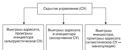
Рис. 1. Виды скрытого управления

Из сказанного ясно, что скрытое управление может производиться с различными целями и намерениями инициатора.